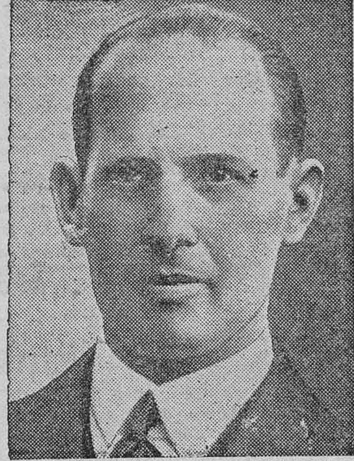
El rey de Grecia, que es esperado en Londres, en viaje de incógnito.

PARIS, 27.—Este tarde ha hablado en Marsella el jefe del Gobierno francés, M. Edouard Daladier, ante el Congreso anual del partido radical-socialista. Su discurso, en lo referente a la situación internacional y a la solución de la reciente crisis europea, ha sido una vibrante defensa del pacto de Munich. Ha dicho Daladier: Yo mantengo mi firme creencia de que para la civilidad europea y para el espíritu tradicionalista liberal de Francia, la solución lograda al conflicto de Checoslovaquia en la reunión de Munich ha sido más favorable que la que se hubiera obtenido por los peligrosos medios de una guerra mundial, de incalculables consecuencias. Refiriéndose a la actitud hostil