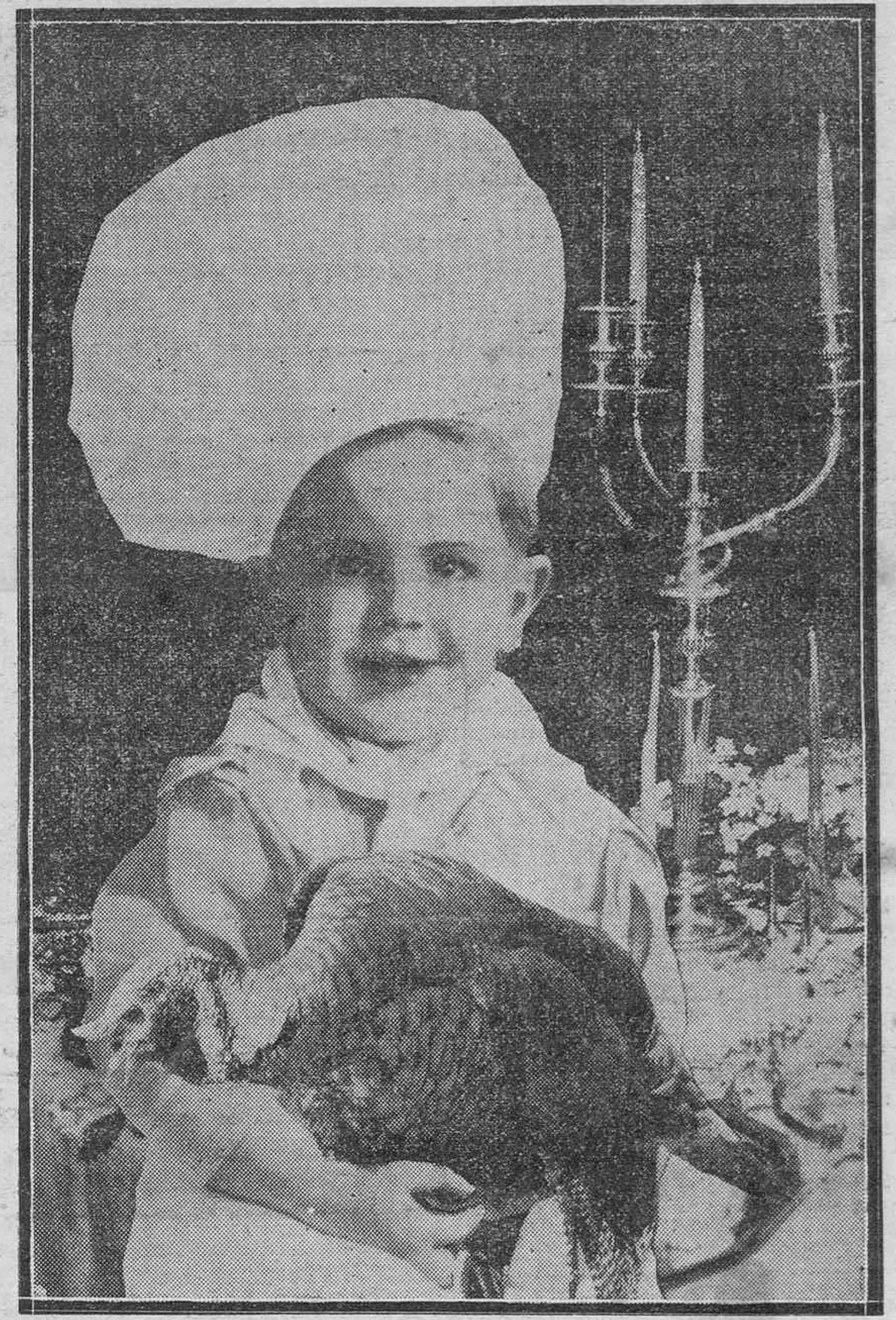
NAVIDAD.—(Foto de A. Benítez.)