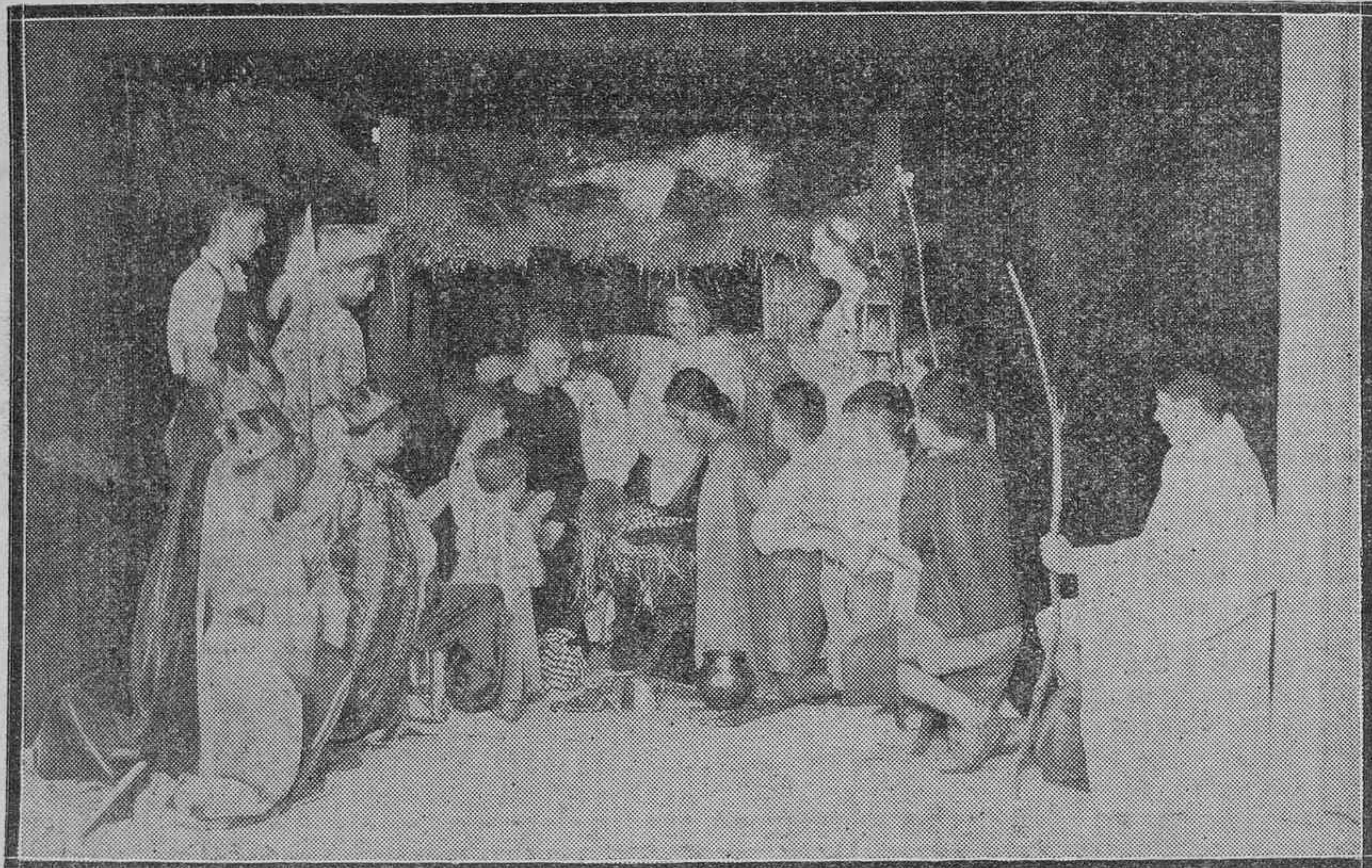
EN EL COLEGIO ALEMÁN.—Un detalle de la brillante fiesta infantil celebrada en dicha institución.