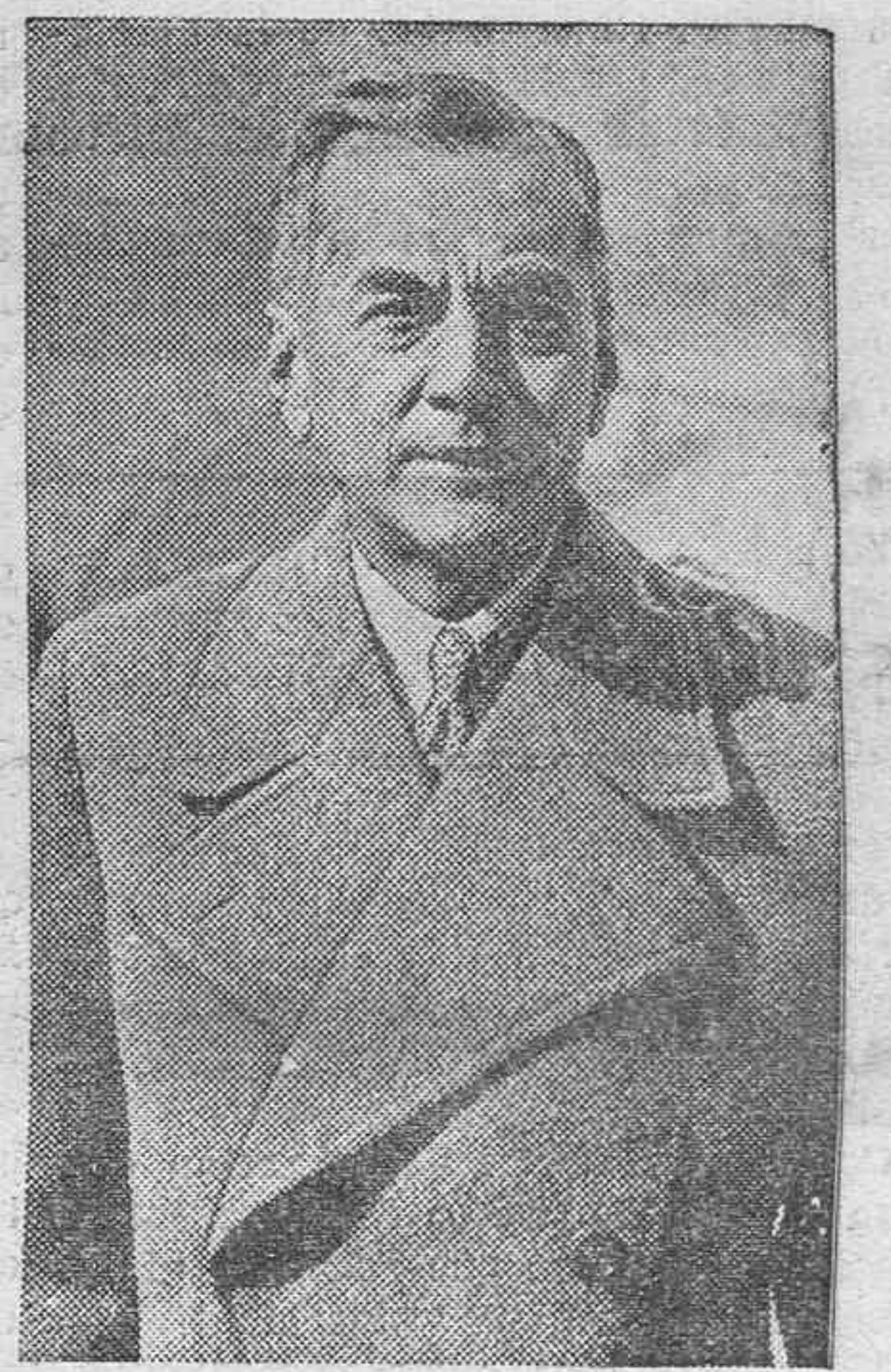
El primer presidente de Filipinas, don Manuel Quezón, que acaba de tomar posesión del Gobierno independiente, después de 37 años bajo la protección de los Estados Unidos.