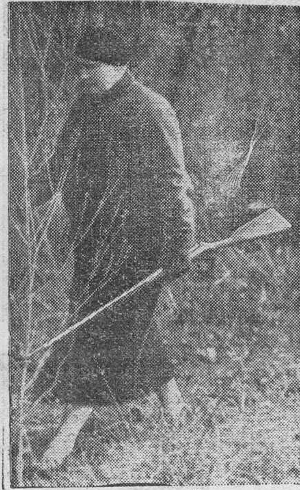
La reina viuda de Yugoslavia, en los bosques de las cercanías de Bucarest, durante una cacería a la que fué invitada por el rey Carlos de Rumania.