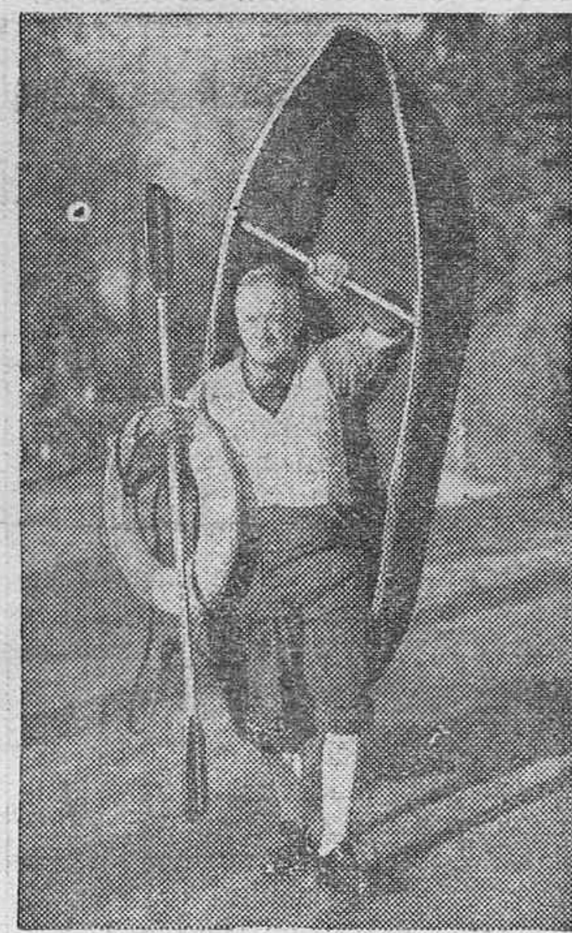
Un habitante de las orillas del Tamesis, en Londres, provisto de un bote y aparato salvavidas para poder trasladarse a su domicilio durante las últimas crecidas del río.