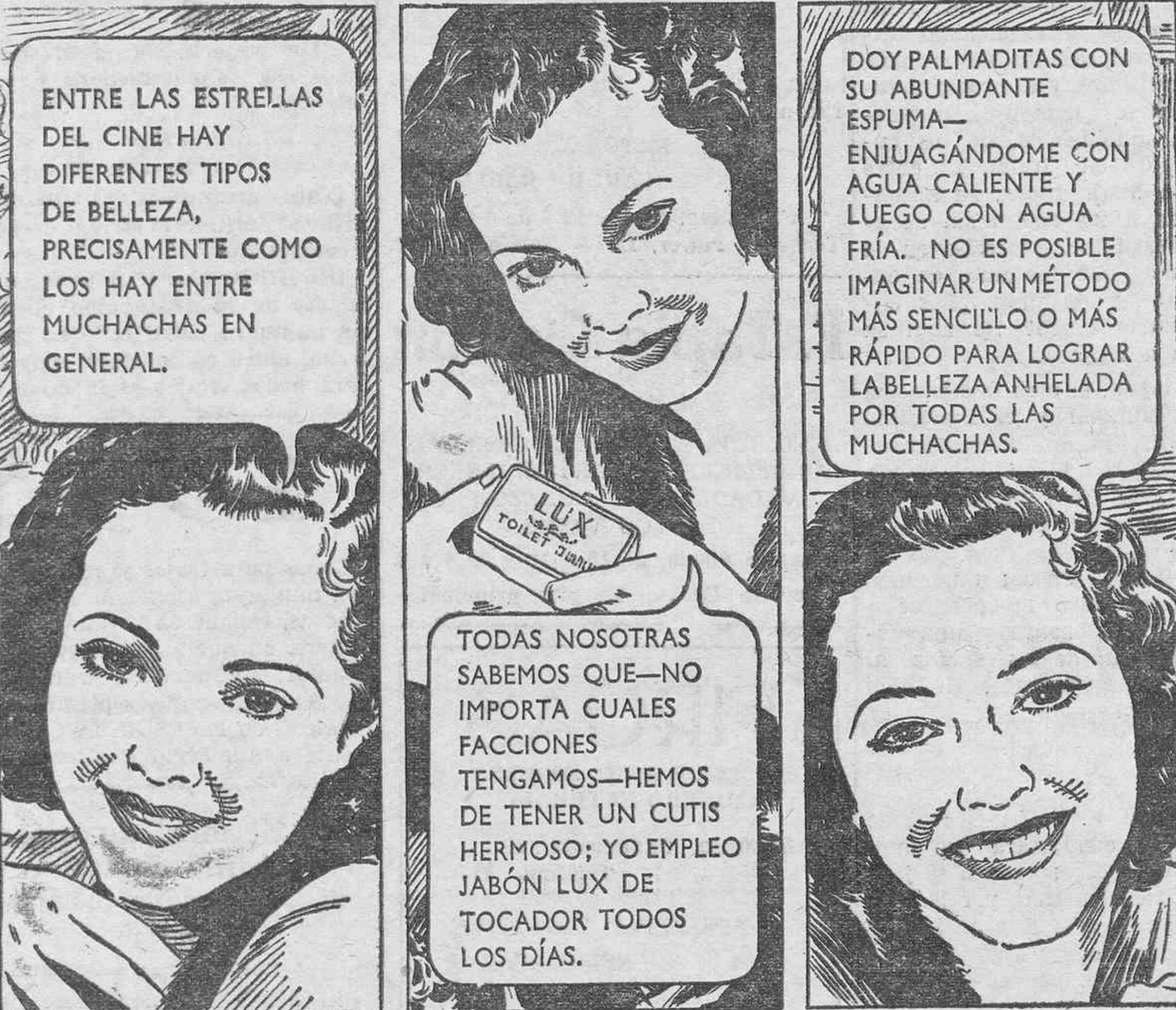
Estrella de Paramount Pictures.