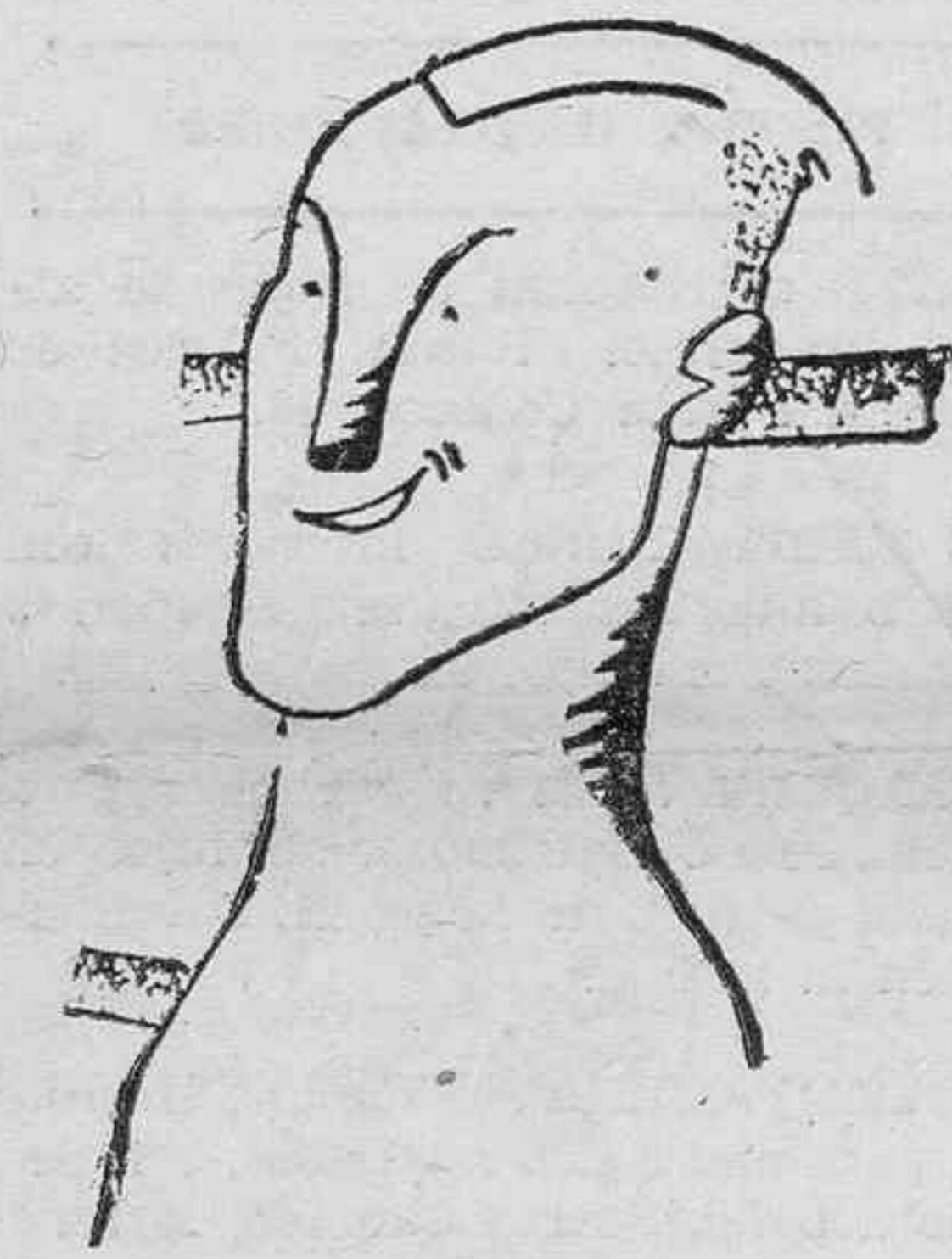
FIGURAS.—Ignacio Ara, notable pugilista.