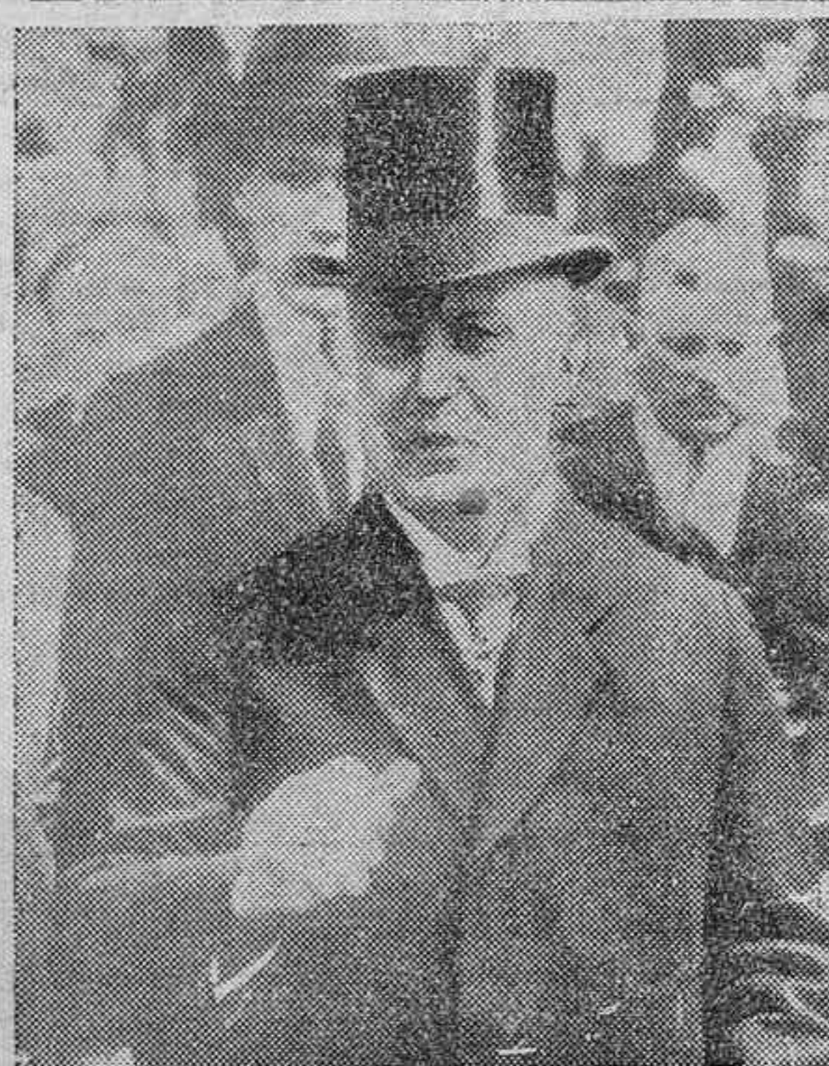
Por recientes fotografías del general Ludendorff, que ayer falleció en Munich

Así pudo derrotarse a los Ejércitos del Sur y la zona oriental de Alemania fué liberada del famoso rodillo ruso. En 1918, y no obstante llevar tres años y medio de guerra y luchar con un enemigo tres veces superior, las tropas alemanas seguían avanzando, bajo los planes del general Ludendorff. El 28 de octubre de 1918, unos políticos traidores a su patria le obligaron a retirarse. Mientras vivió el general Ludendorff —dice esta noche un periódico de Berlín—, ningún soldado extranjero puso pié en Alemania. El 9 de mayo de 1923, se colocó al lado de Hitler para salvar a Alemania del caos y de la humillación, contribuyendo al triunfo del nacional-socialismo.