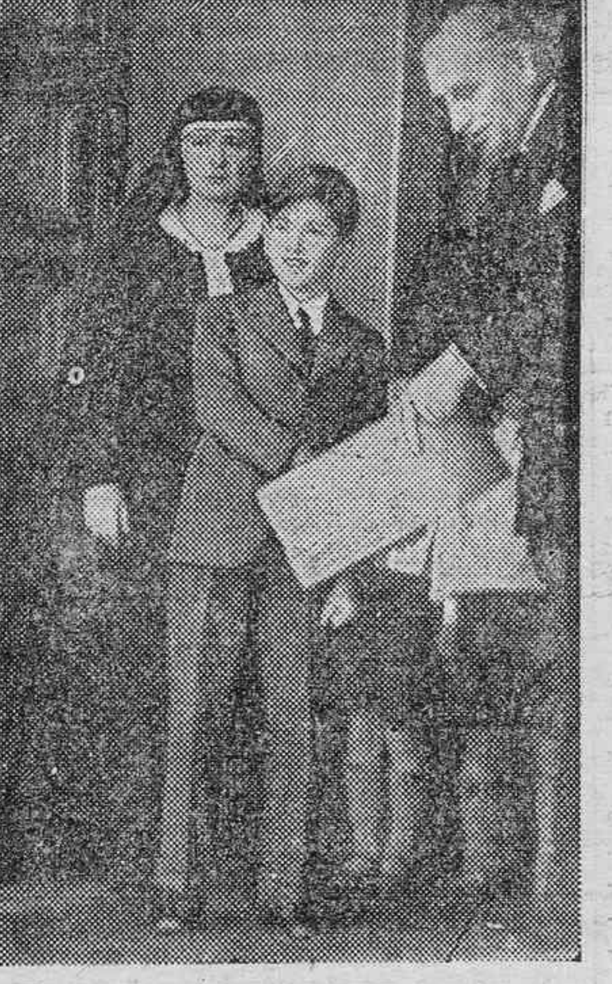
El rey Pedro de Yugoslavia, cuyo Gobierno se dice que ha reconocido también a la España nacional.