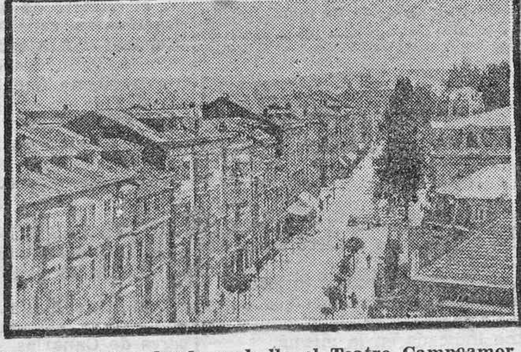
DOS DETALLES DE OVIEDO.—A la izquierda: Plaza del 27 de Marzo, donde se halla el Teatro Campoamor, que aparece al fondo.—A la derecha: Una de las principales vías de la ciudad.