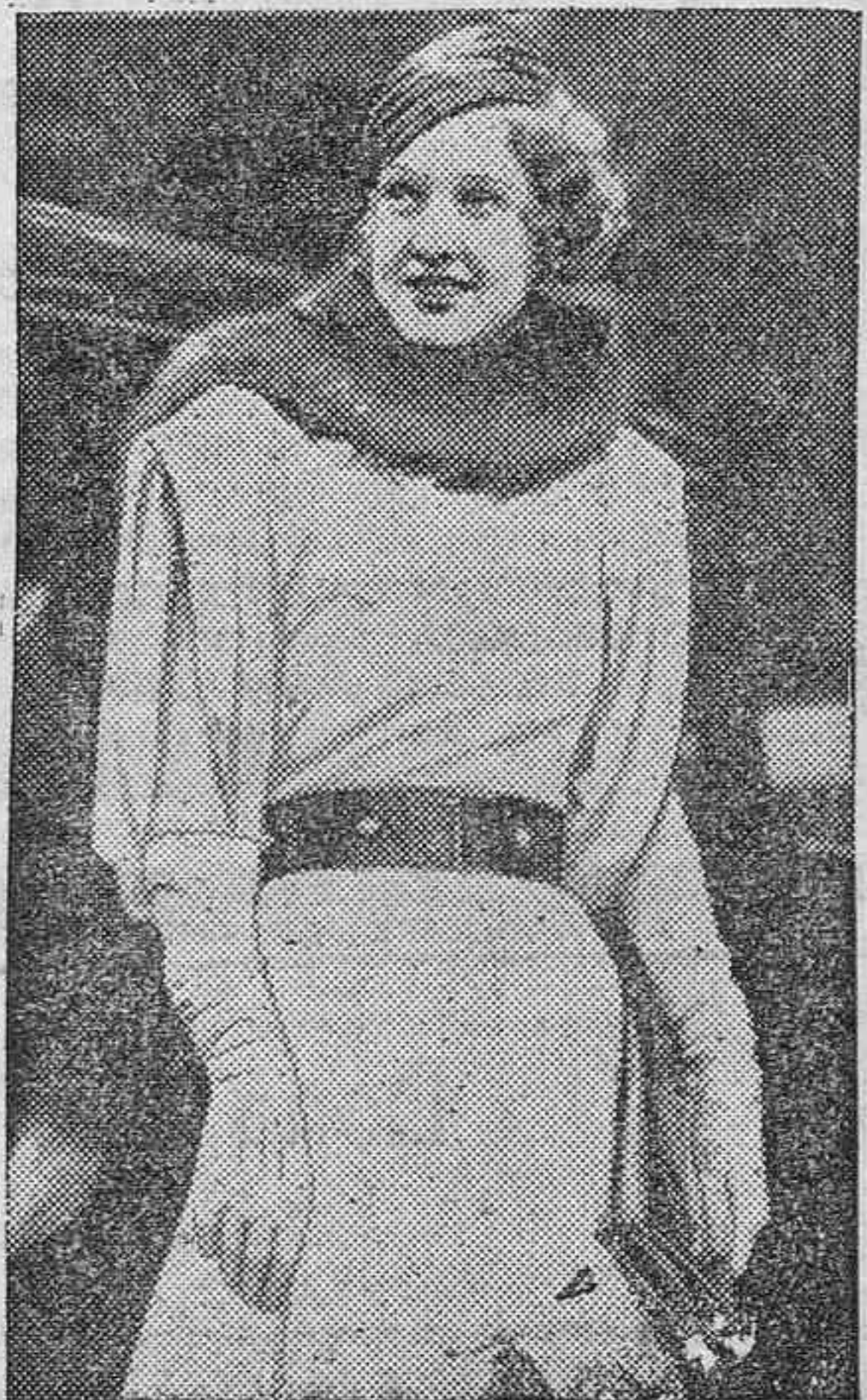
Madame Aga, esposa del actual Presidente de la Sociedad de Naciones, Aga Khan.—Un árabe de la Palestina, donde nuevamente se ha creado una situación en extremo violenta, que preocupa al Gobierno de la Gran Bretaña.—Soldado inglés, custodiando un edificio público en Jerusalén.