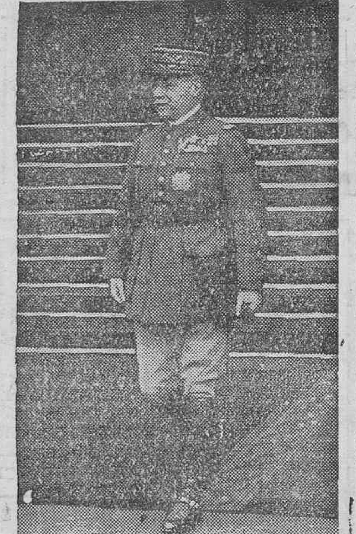
El general Gamelin, jefe del Estado Mayor francés, que ha marchado a Londres con una importante misión militar, relacionada con las próximas maniobras francesas.

Valencia, 2.—Una escuadrilla de aviones nacionales bombardeó a unos barcos rojos, cerca de la costa levantina. En auxilio de los barcos salió una escuadrilla de Valencia, que fué dispersada por los nacionalistas. (Havas).