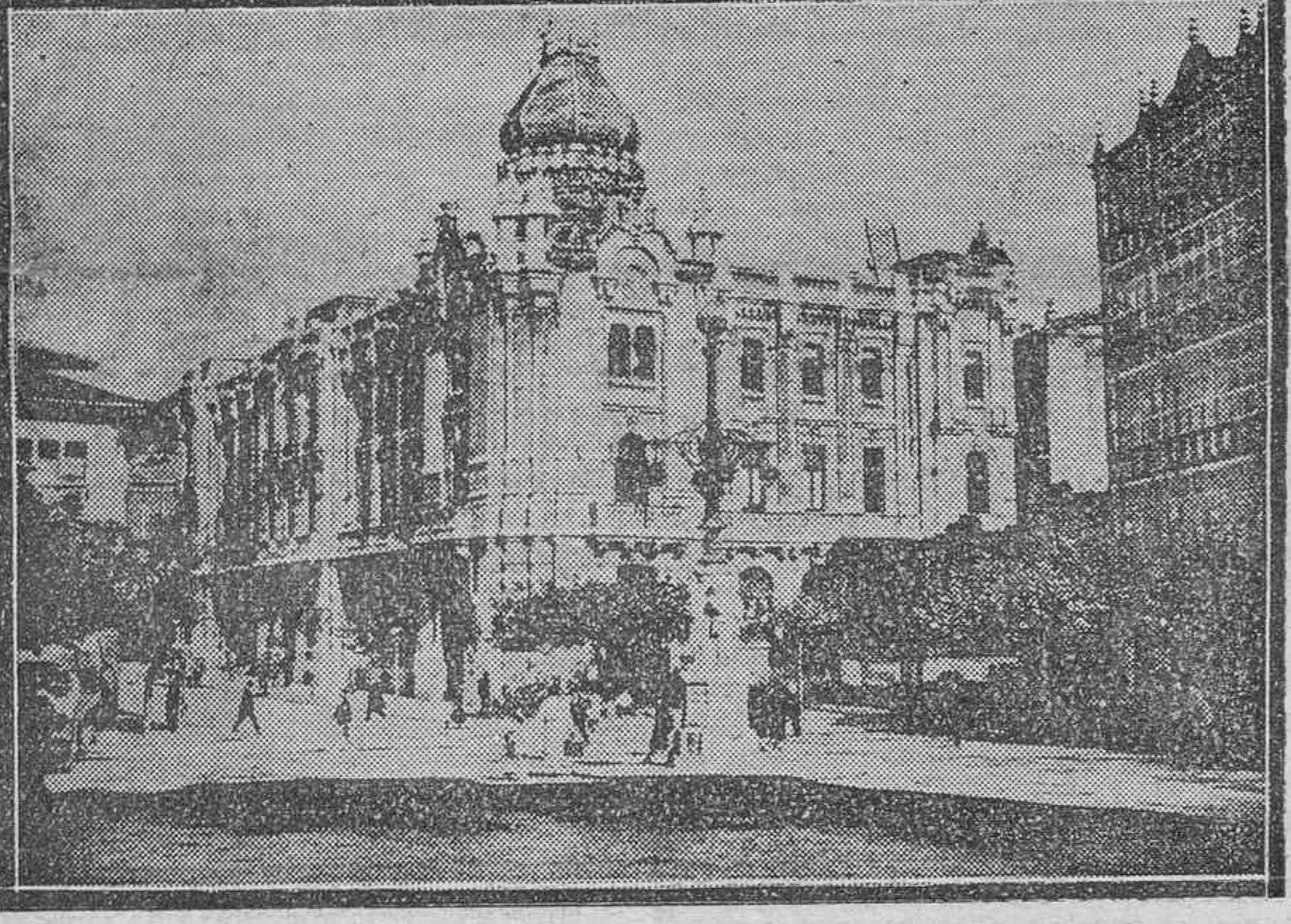
DOS DETALLES DE SANTANDER.—A LA IZQUIERDA, EL PASEO DE PEREDA; A LA DERECHA, EL MAGNIFICO EDIFICIO DEL AYUNTAMIENTO.

Santander, la bella capital montañesa donde a estas horas habrán entrado triunfalmente las gloriosas tropas del Norte, se halla situada en una lengua de tierra que se interna en el mar. Un clima ideal, un prodigio de belleza natural, una elegante playa, un centro de deportes de gran importancia: he aquí, entre otras numerosas atracciones, lo que Santander ofrece a sus visitantes. El clima de Santander, tibio y dulce en invierno como en verano, es particularmente exquisito cuando la brisa fresca del mar, que la ciudad recibe gracias a su situación, conserva una temperatura suave sin cambios bruscos, sobre todo durante los meses de calor. Es este un privilegio que no todas las playas y muy pocas ciudades veraniegas poseen en tan alto grado y con tal persistencia. Según los datos oficiales del Observatorio de Santander, la temperatura media en verano ha oscilado en 14 grados, y en el mes de julio, el de más calor, la temperatura media ha sido sólo de 19, mientras