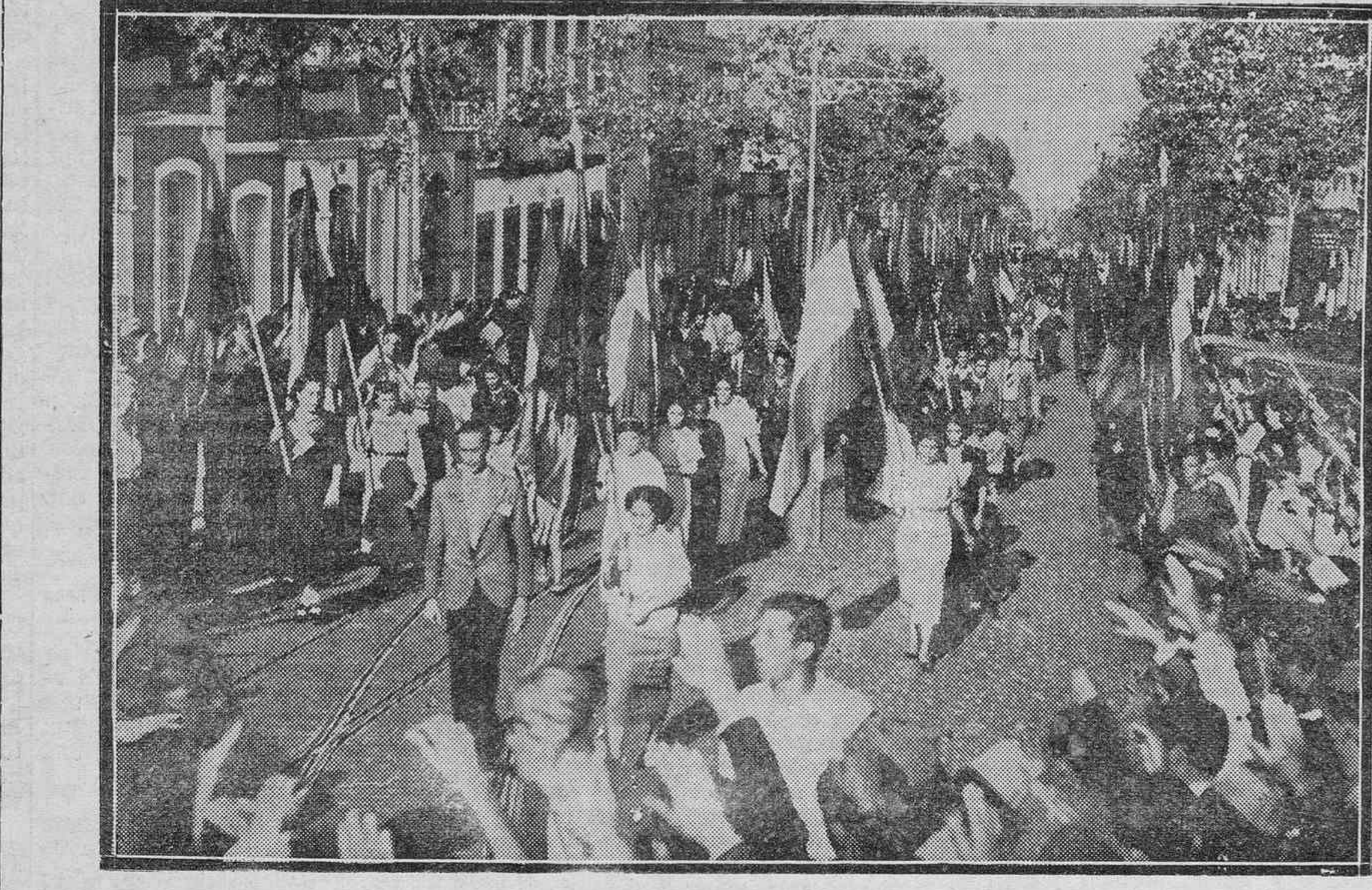
UN DETALLE DE LA IMPONENTE MANIFESTACION CELEBRADA EN LA TARDE DEL DOMINGO.