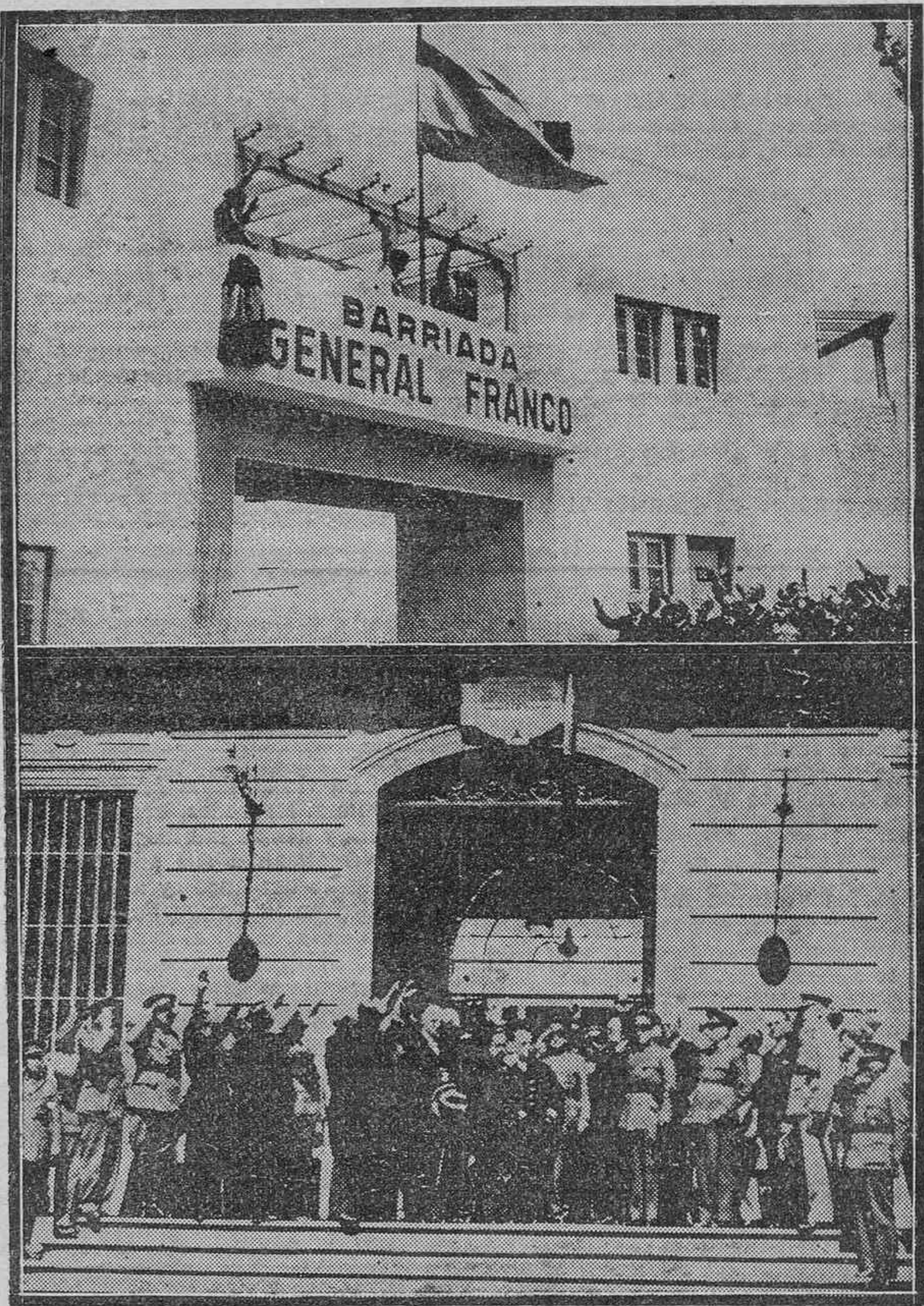
Arriba: El momento de izarse la enseña nacional en el grupo de Casas Baratas, "General Franco", cuya inauguración tuvo lugar el domingo al mediodía con asistencia de las autoridades.—Abajo: Un detalle del acto celebrado el sábado último en la Comandancia General, con motivo de descubrirse una lápida conmemorando la fecha en que el Generalísimo Franco inició desde estas islas el movimiento nacional.

Salamanca, 19 de julio de 1937. —De orden de S. E. el General Segundo Jefe de Estado Mayor, Francisco Martín Moreno.