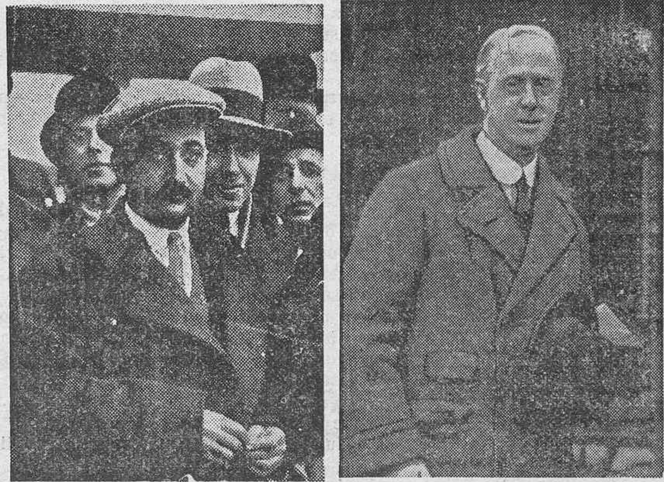
El famoso aviador español, Ramón Franco, que ha salido de Washington para España con objeto de sumarse a la aviación del Ejército.