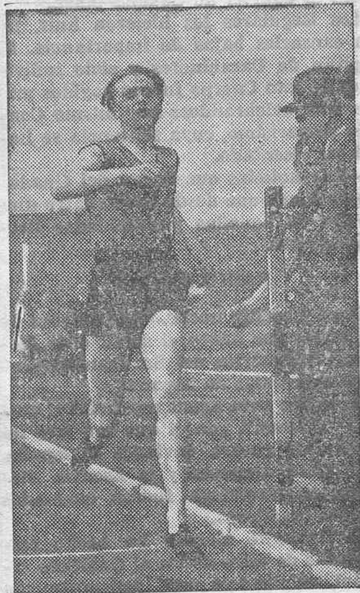
Zdenka Koubkova, recordwoman de los 800 metros, disputando una carrera cuando aún era mujer.

de la delegada sudafricana, pero no obstante todo, en el aspecto de la citada atleta revelaba al hombre: un ancho de espaldas fuera de lo común, busto plano, voz cavernosa... etc.