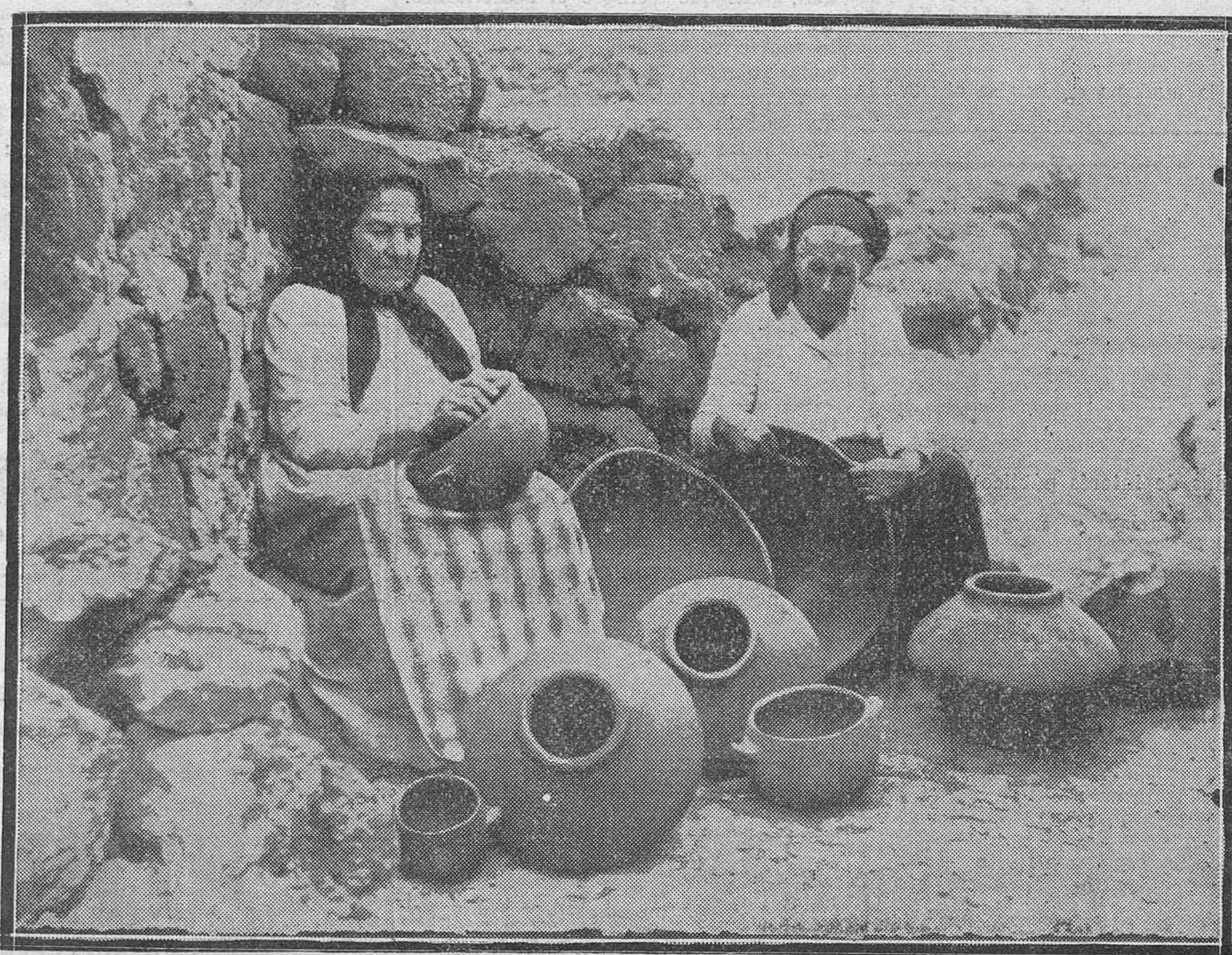
LA VIEJA INDUSTRIA DE ALFARERIA EN TENERIFE.—(Foto Bacallado.)

A las 4 de la tarde del sábado llegó el "Highland Brigade" con pasaje-