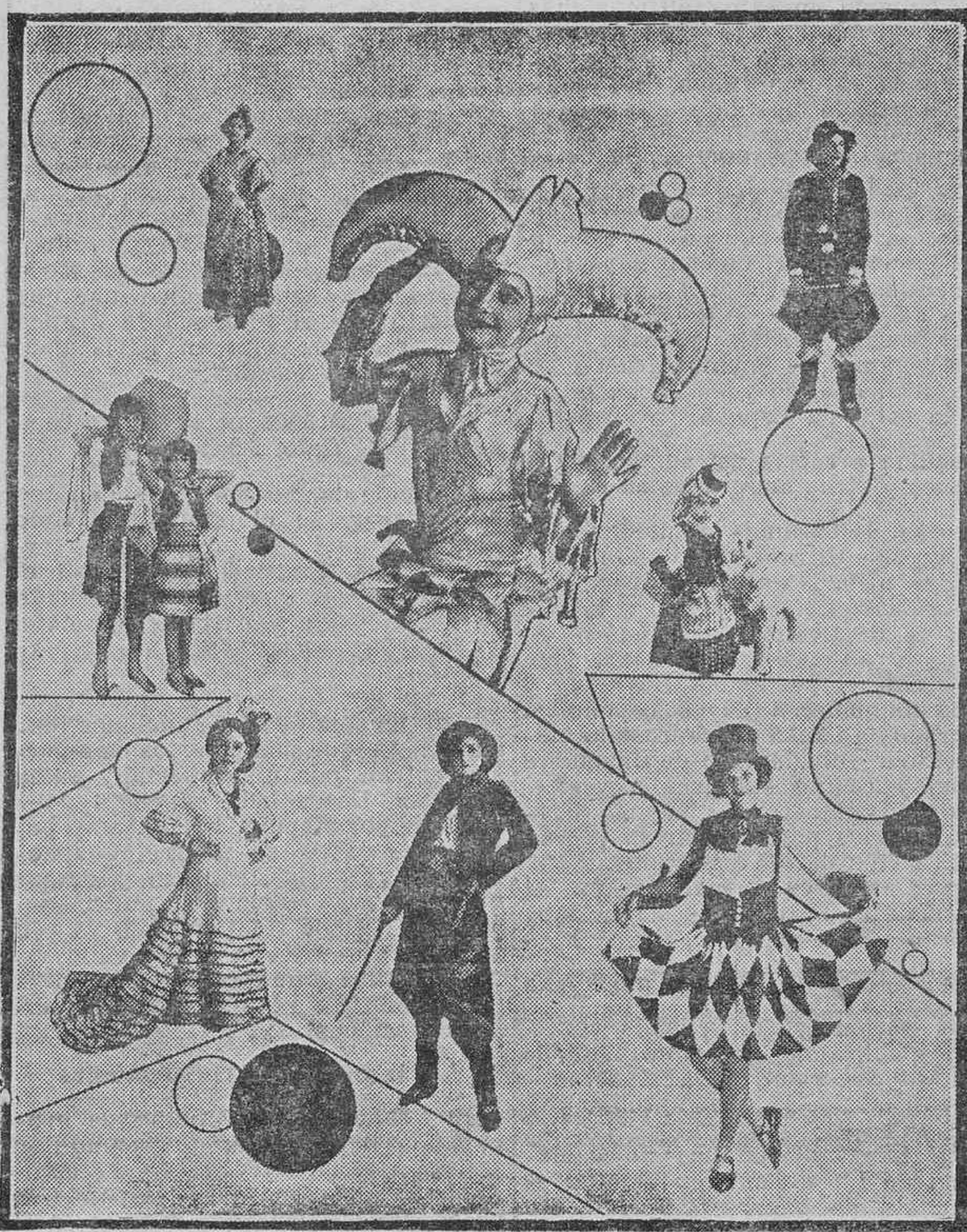
DEL CARNAVAL.—(Composición fotográfica de Adalberto Benítez)