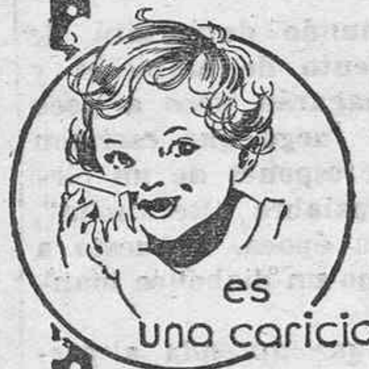
es una caricia

El Jabón Richelet es imprescindible para combatir todas las afecciones de la piel.