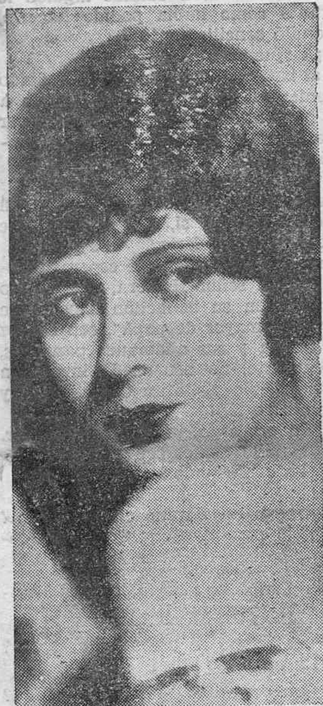
René Adorée, le encantadora Melisande de "El gran desfile", ha muerto en Hollywood. La terrible dolencia que alejó del "cinema" americano...