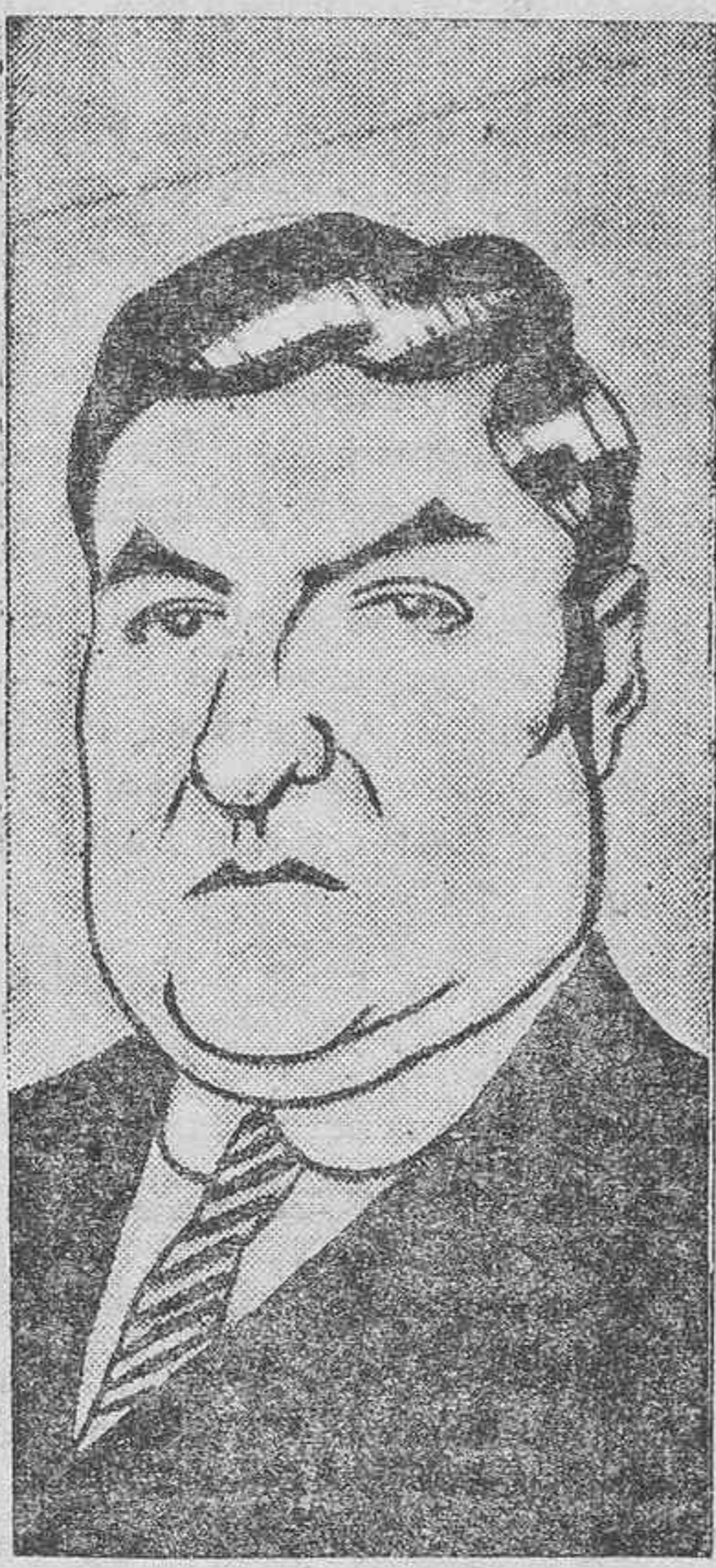
ACTUALIDADES GRAFICAS.—El ex-presidente de Méjico, Portes Gil, que según los telegramas de ayer ha sido designado delegado de aquella República en la Sociedad de Naciones. — La célebre «star» Aileen Pringle, una de las artistas predilectas del público americano.

Importa mucho, pues, que en esta gestión que inician los diputados isleños conjuntamente, no se les deje solos, pues que a todos nos interesa por igual el asunto. Tenganlo presente así las corporaciones representativas, cuya actividad ha comenzado ya a manifestarse, pero que precisa sea refrendada en los momentos decisivos con la evidencia de las razones que la misma realidad de nuestra economía nos brinda.