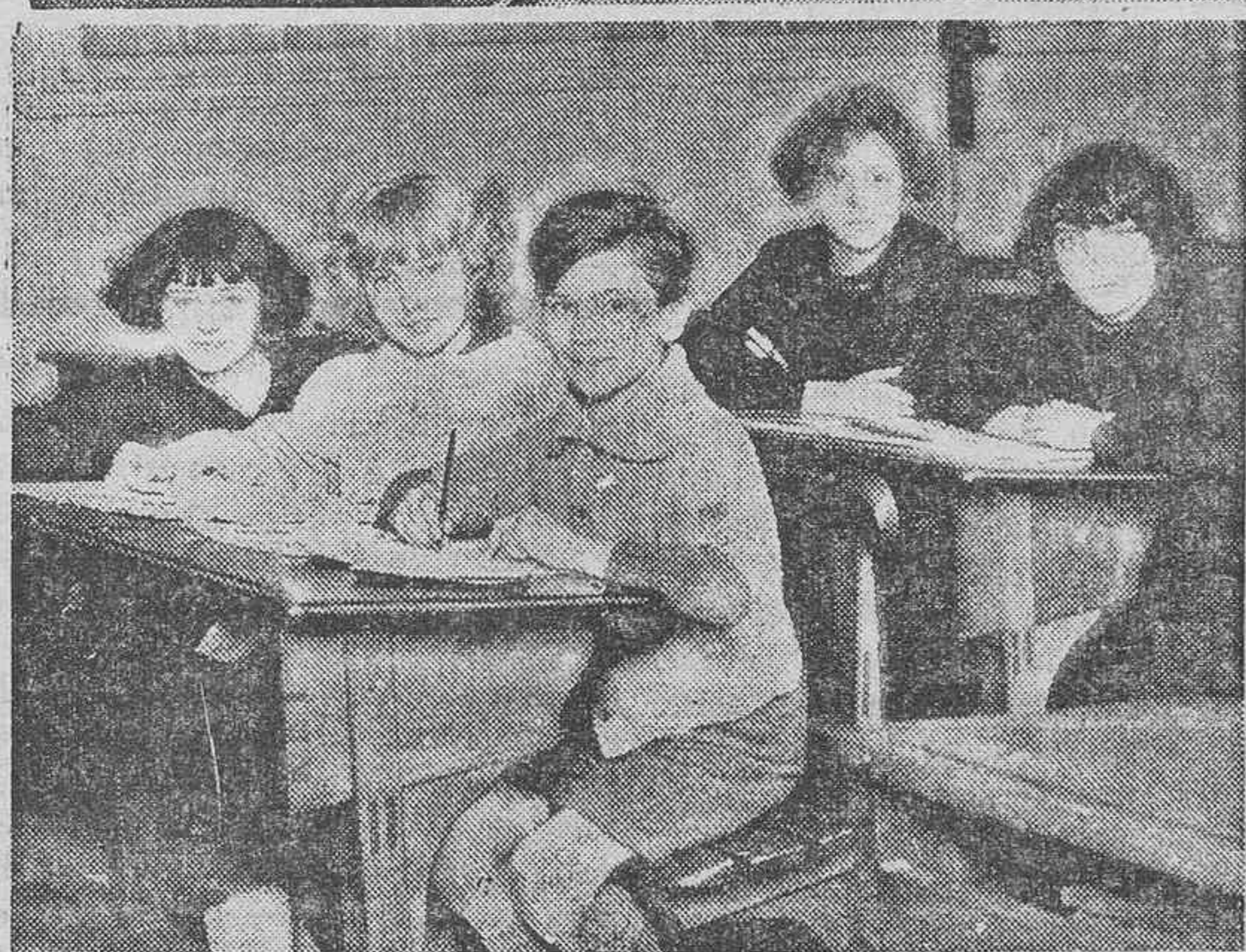
INFORMACIONES GRAFICAS.—Una futura "estrella" practica ejercicios de entrenamiento físico.—Una interesante escena escolar en Francia