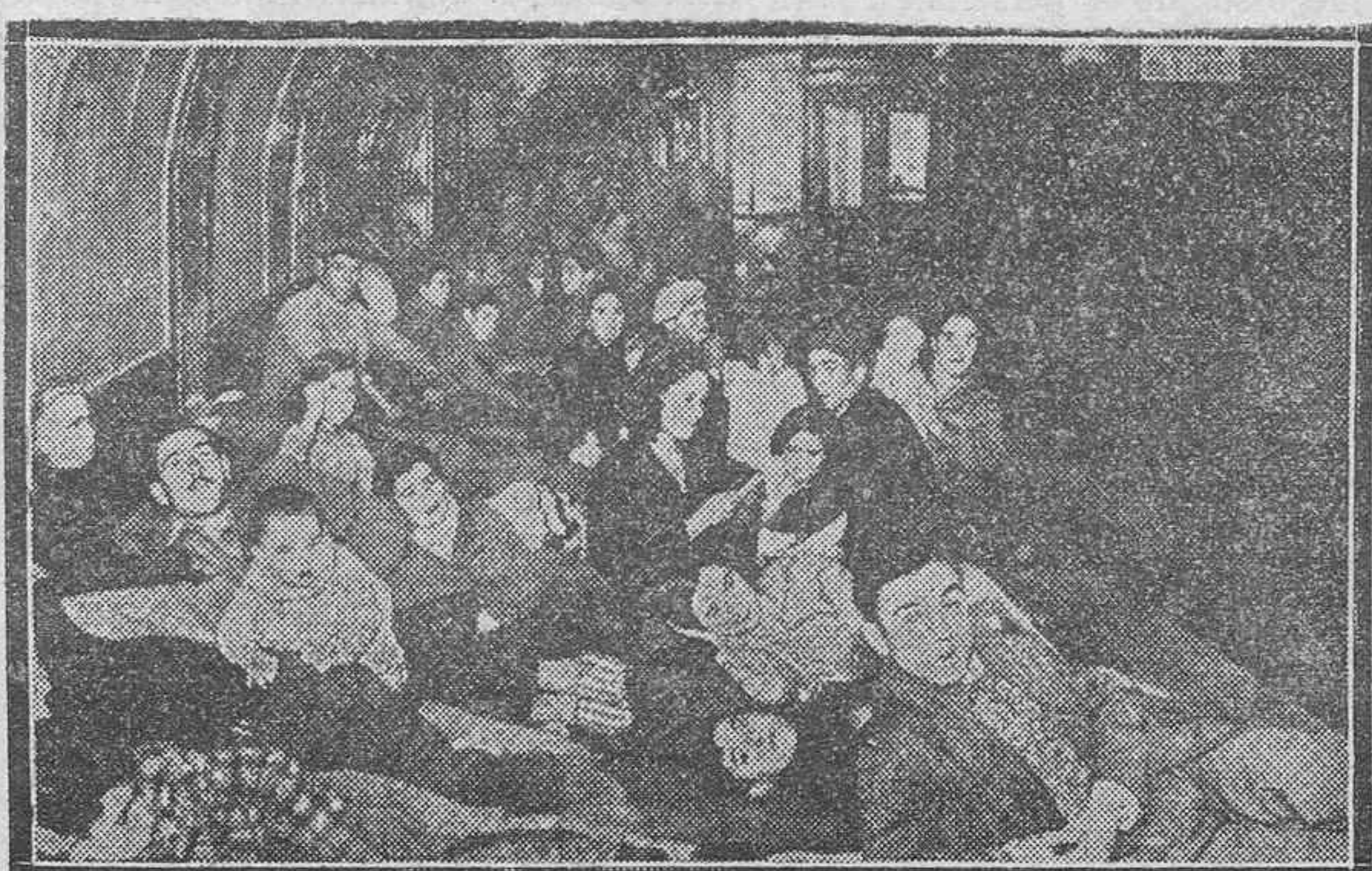
Un detalle del refugio del Metro, donde se hacina una gran parte de la población de Madrid durante los bombardeos de la artillería nacionalista.