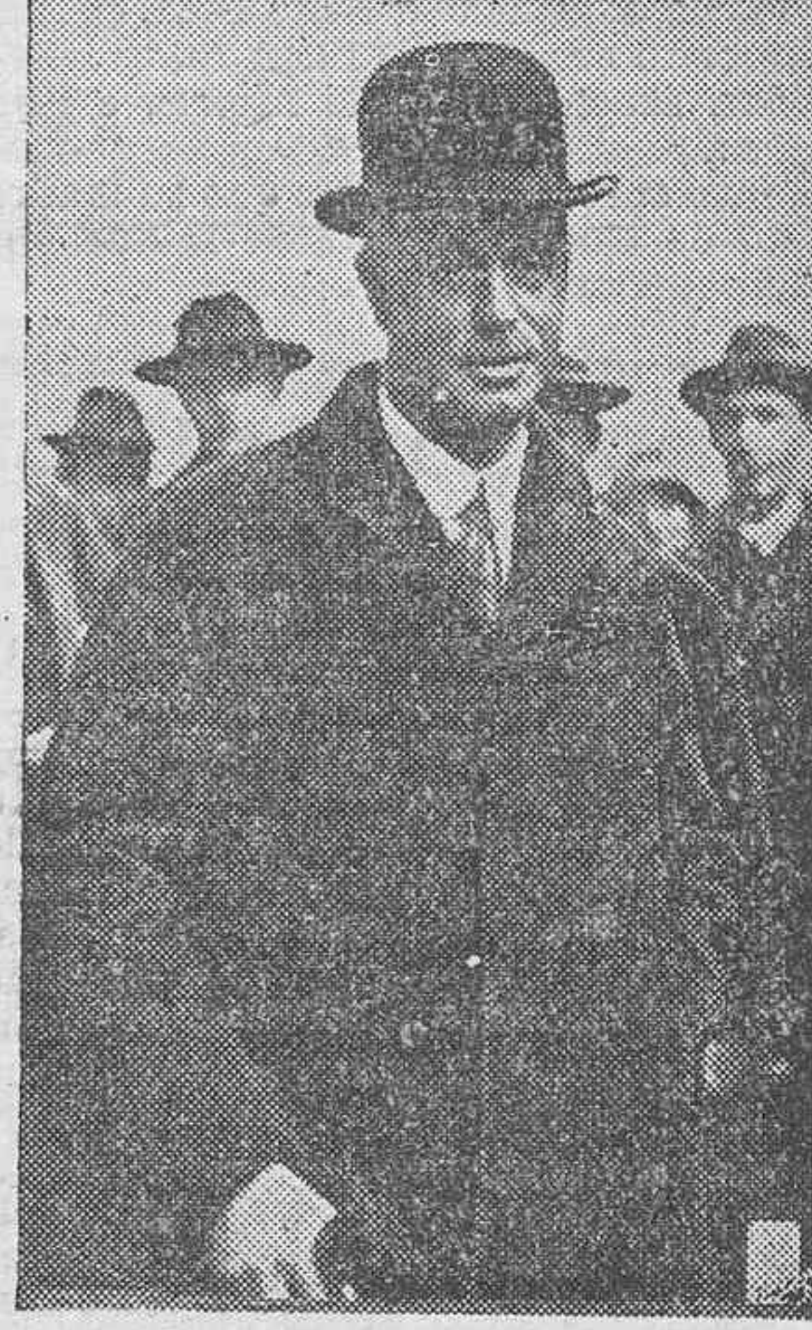
El Embajador de Inglaterra en Roma, Sir Eric Drummond, que ha celebrado una entrevista con el ministro de Relaciones Exteriores de Italia...

GANAR DINERO Y LABORAR EN BENEFICIO DE TENERIFE. ESTO SOLO SE LOGRA ADQUIRIENDO DECIMOS DE LA LOTERIA PATRIOTICA PARA EL CAMPO DE AVIACION.