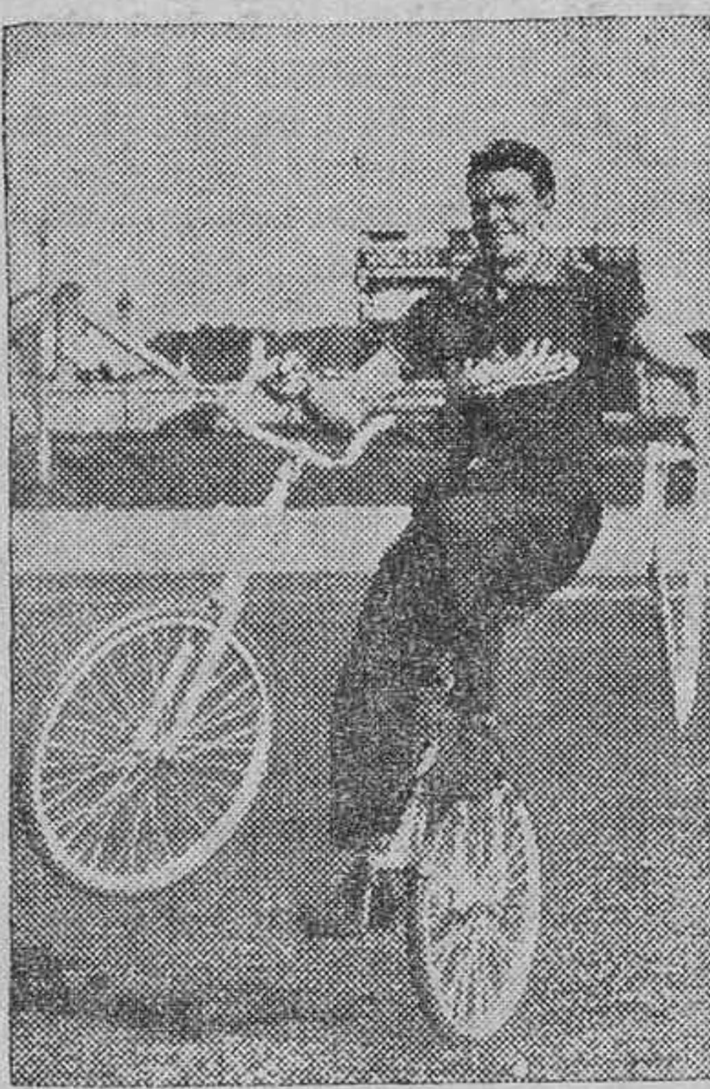
Lo que se puede hacer con una bicicleta...