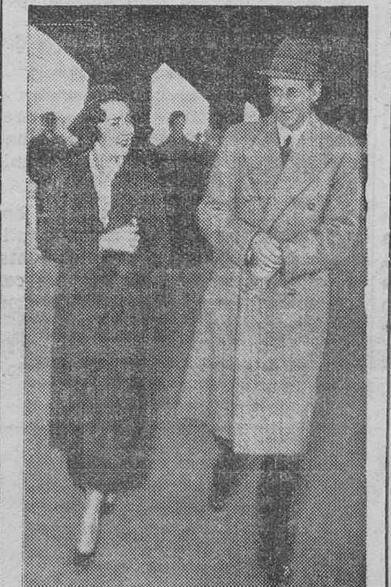
El príncipe Federico, heredero de la Corona de Dinamarca, y la princesa Ingrid, de Suecia, que el día 24 del actual contraerán matrimonio. Con tal motivo se preparan grandes fiestas en ambas naciones.

de mayo, dos coches automotores eléctricos, dotados de grandes ventanales, a los cuales se ha dado el nombre de "coches panorámicos". Este nombre estará doblemente justificado por la construcción especial de los coches, concebidos con vistas a obtener la máxima visibilidad, y por el carácter de las regiones donde prestarán servicio, escogidas entre las más pintorescas de Alemania.