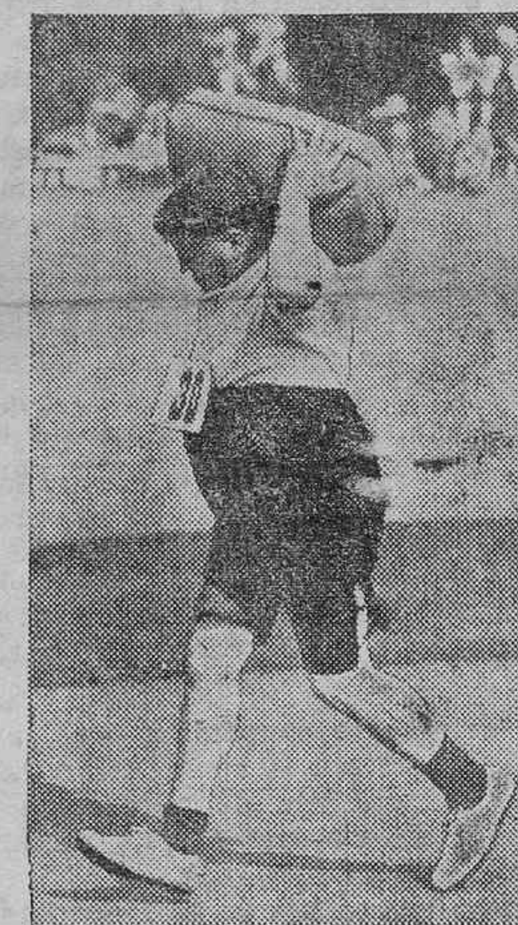
... Y lo que puede hacer un gordito con voluntad