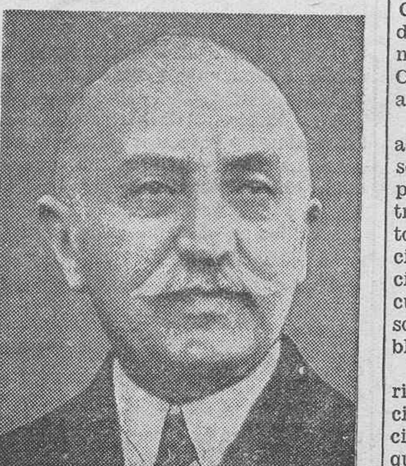
El señor Tsaldaris, jefe del Gobierno griego, que ha tomado energicas medidas para reprimir el movimiento.

Debido a las insistentes gestiones llevadas a cabo por nuestra Embajada y Consulado general en La Habana, se ha reconocido a los obreros españoles despedidos de sus empleos y ocupaciones el derecho a una indemnización de cien mil pesos a título de reintegro, de gran parte de las cuotas que dichos obreros tenían depositadas en la Caja de jubilaciones y pensiones. Por otra parte se ha incrementado en la medida hasta donde lo han permitido, los recursos económicos disponibles, la cantidad consignada para repatriaciones, lográndose además de las Compañías de navegación una reducción en el billete de pasajes para los repatriados. Todo lo cual ha permitido y permitirá paulatinamente dar satisfacción a las numerosas demandas de repatriación recibidas en los distintos consulados de aquella isla. Por el momento, con estas medidas y con el trabajo que algunos de los ciudadanos españoles residentes en Cuba habrán de tener hasta mediados del mes de junio con motivo de la recolección del azúcar cuyas tareas comienzan ahora, se va aliviando un tanto aquella situación. Otro aspecto en orden a intereses españoles no están tampoco desatendidos, pues el Gobierno los atiende con toda la solicitud necesaria."