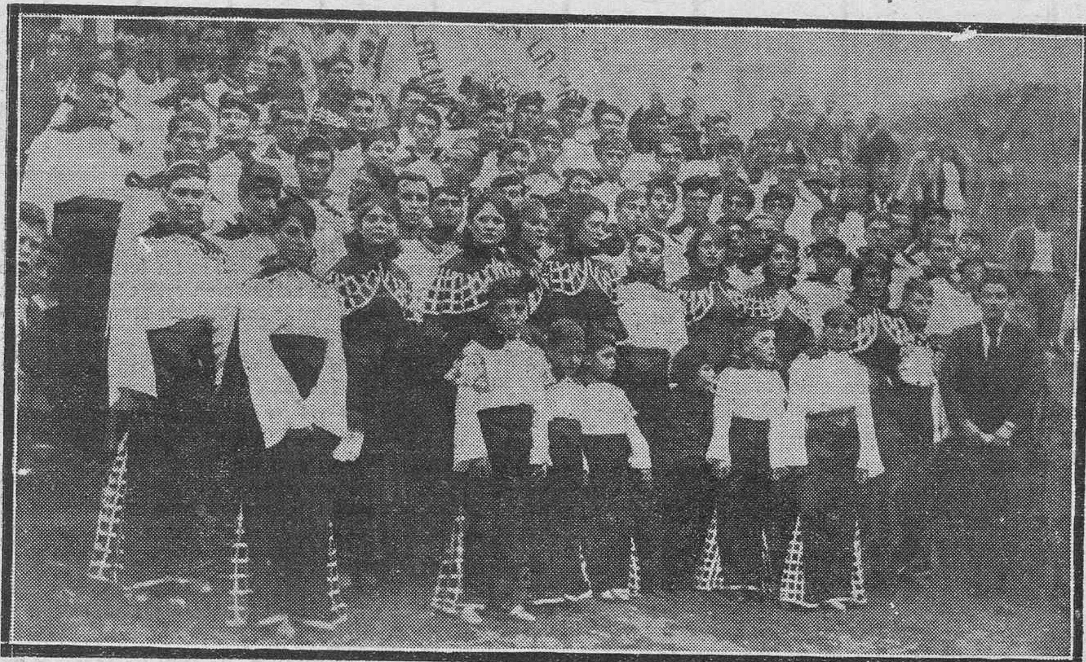
DEL CONCURSO DE RONDALLAS.—La notable agrupación del Orfeón "La Paz", de La Laguna, que obtuvo el primer premio en el Concurso de rondallas del domingo de Carnaval.