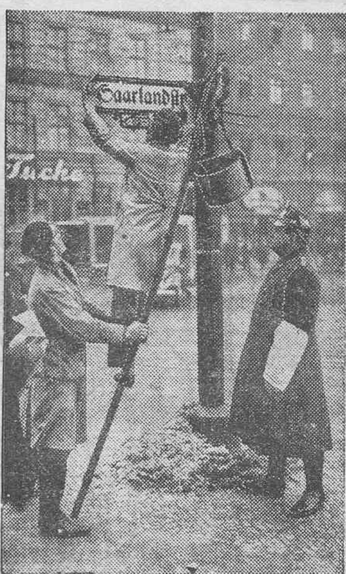
Tan pronto se conoció el resultado del plebiscito del Sarre, que llevaba una calle de Sarrebruck, fué cambiado por el de Saarlandstrasse.