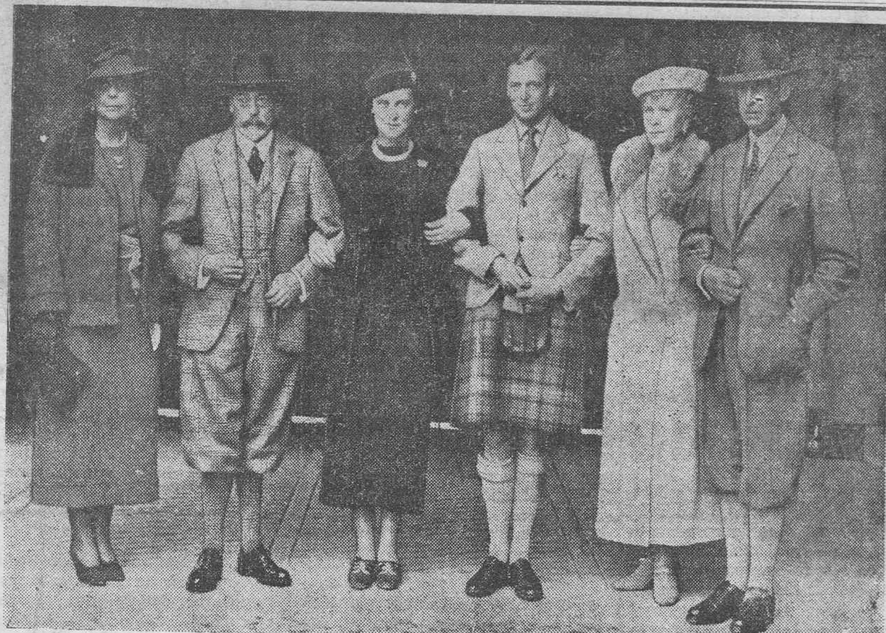
He aquí a los duques de Kent, princesa Marina y príncipe Jorge (al centro de la fotografía), que en la mañana de hoy llegarán a Tenerife a bordo del vapor "Duchess of Richmond", en viaje de turistas, y de paso para América.