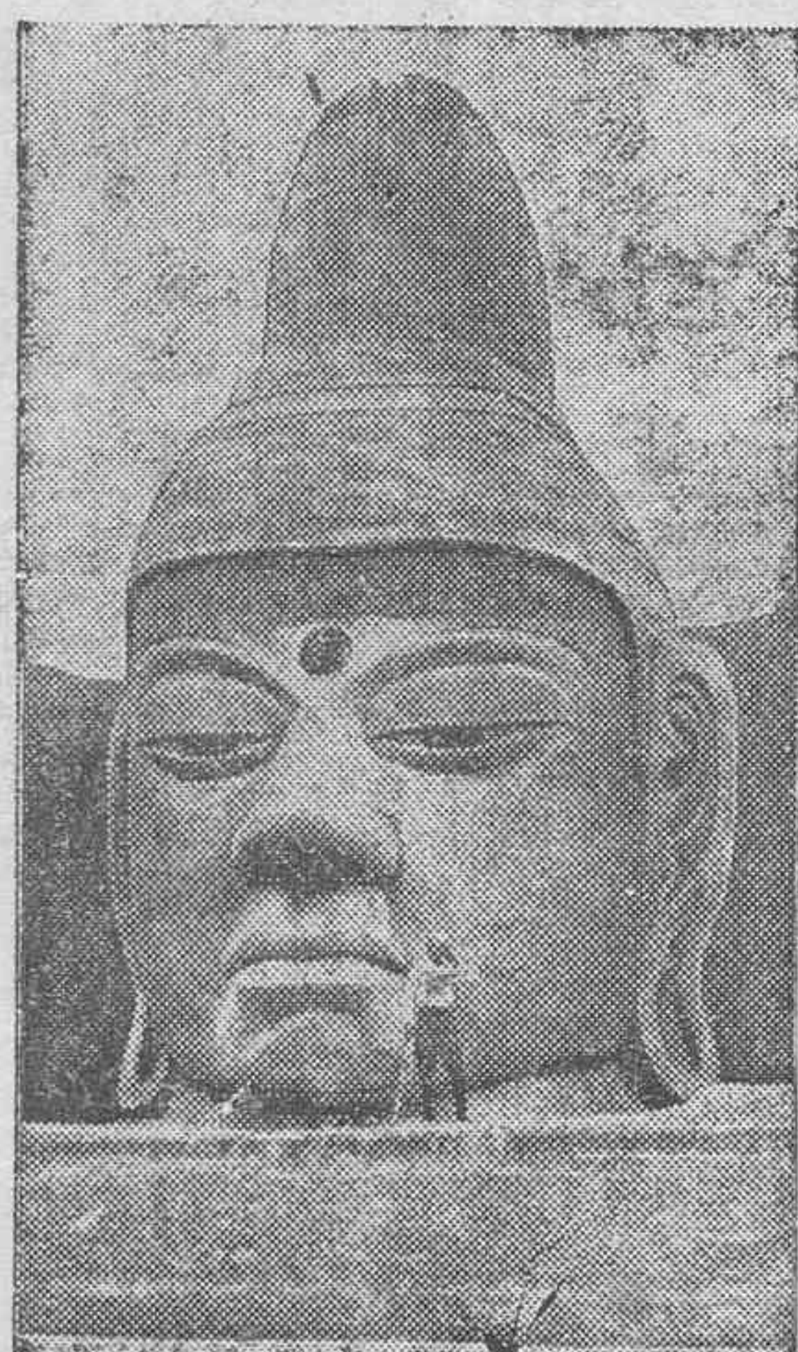
La gigantesca estatua de Budha, tallada en roca viva que va a erigirse en Tokio, al Norte de la capital. La cabeza tiene una altura de treinta pies y la figura entera 114.