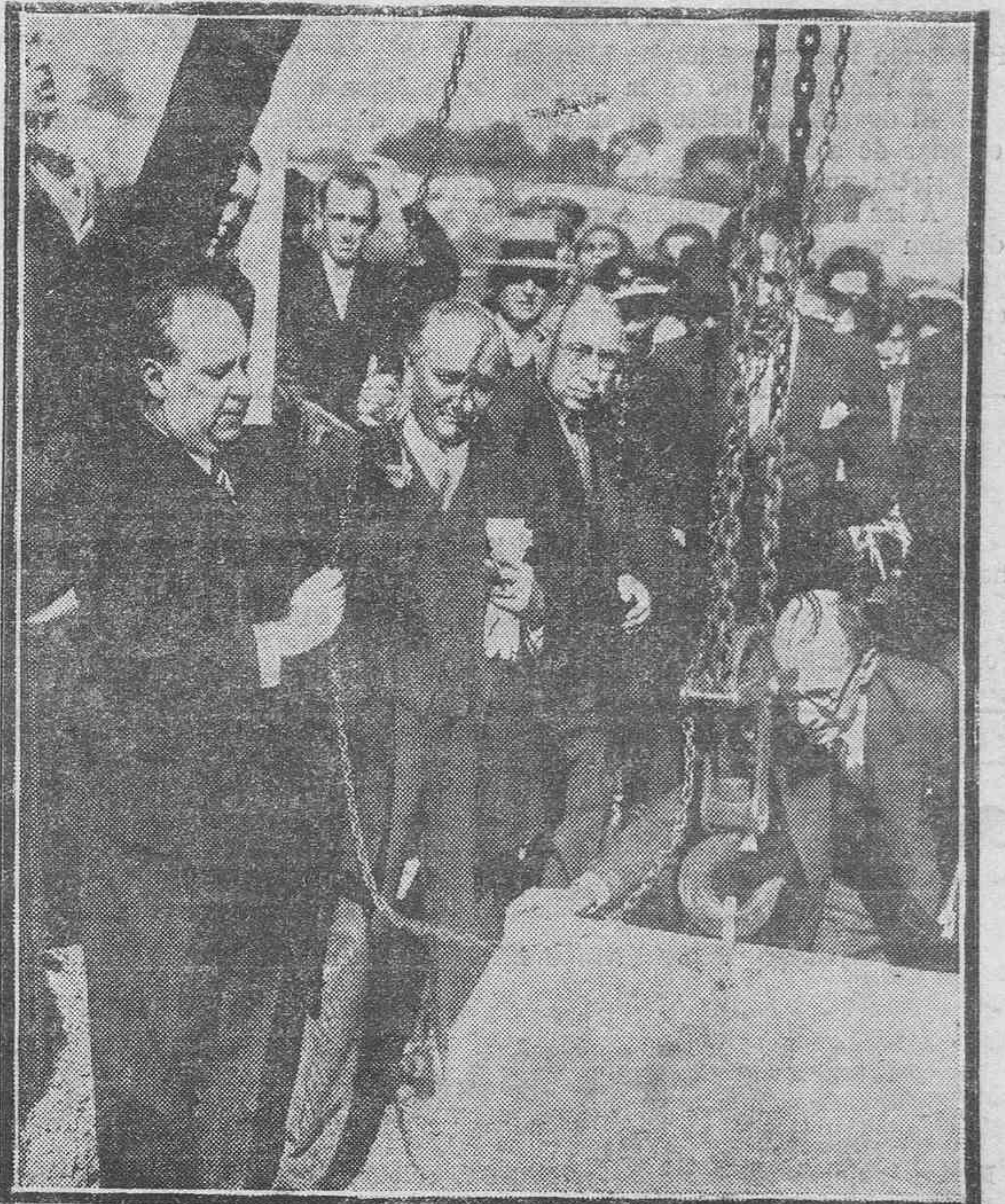
OTRO DETALLE DE LA COLOCACION DE LA PRIMERA PIEDRA DEL FUTURO EDIFICIO DE LA PRISION.

El presupuesto de las obras asciende a unos tres millones de pesetas, distribuidos en tres anualidades.