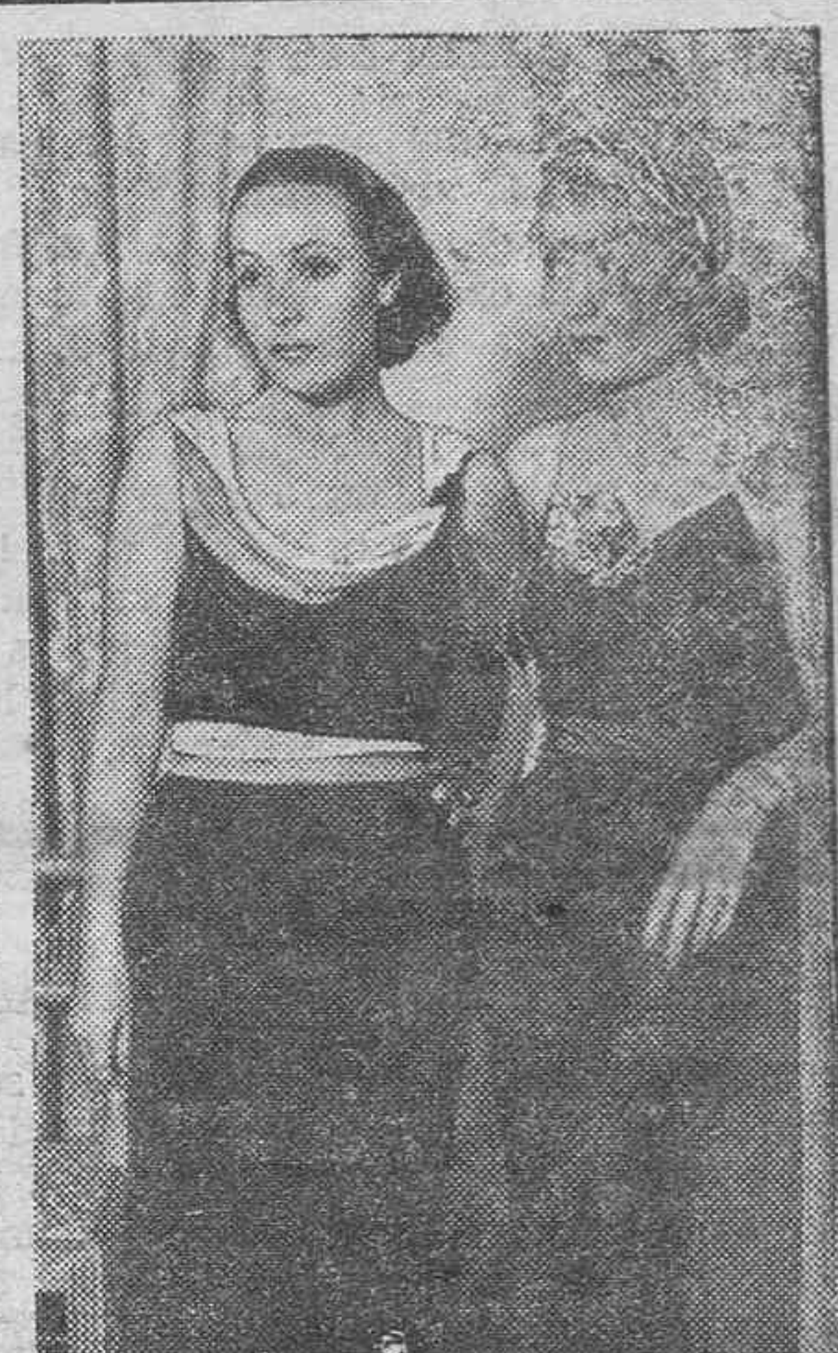
Las célebres artistas Dolores del Río y Constanza Bennet, fotografiadas durante el baile tradicional de Pascua celebrado en Los Angeles, en el que se hace un extraordinario derroche de elegancia y buen gusto.