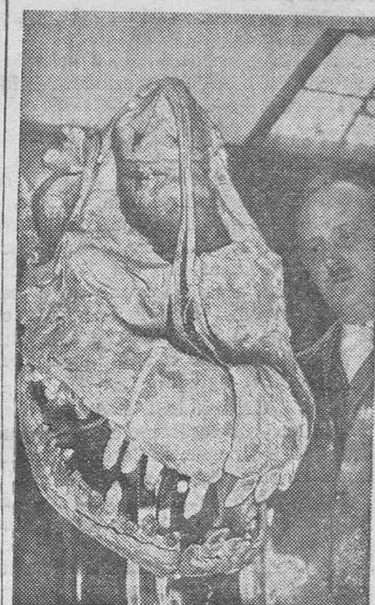
En el museo zoológico de Berlín, se está reconstruyendo el esqueleto del animal más grande que ha existido, o sea un "branchiosaurus", del cual se han encontrado huesos en Africa. Se calcula que durará unos 30 años la reconstrucción de todo el esqueleto. En el grabado se ve el cráneo casi terminado.