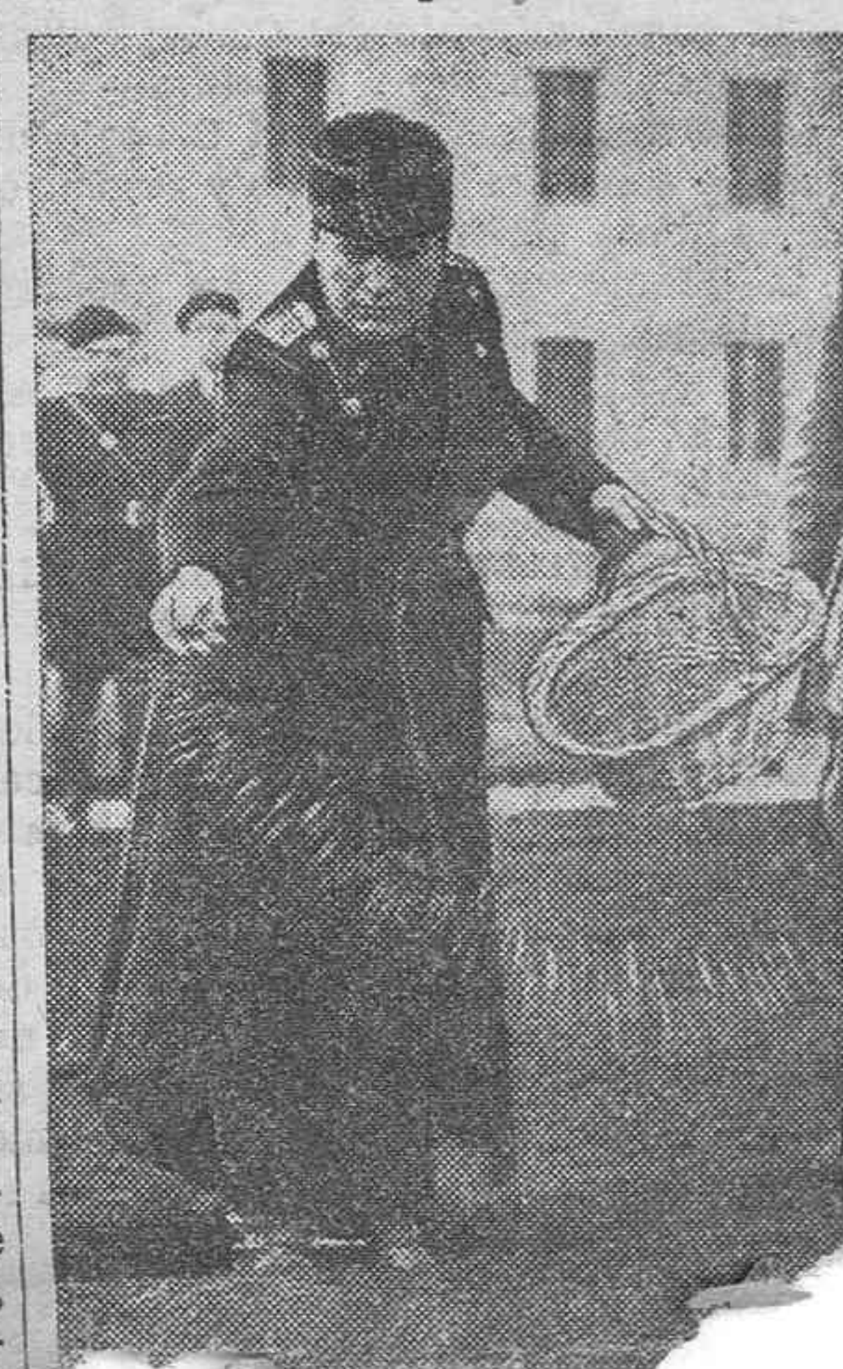
Mussolini, sembrando por primera vez un área de terreno, en los antiguos pantanos de la región pontina, que han sido desecados para convertirlos en tierra laborable.