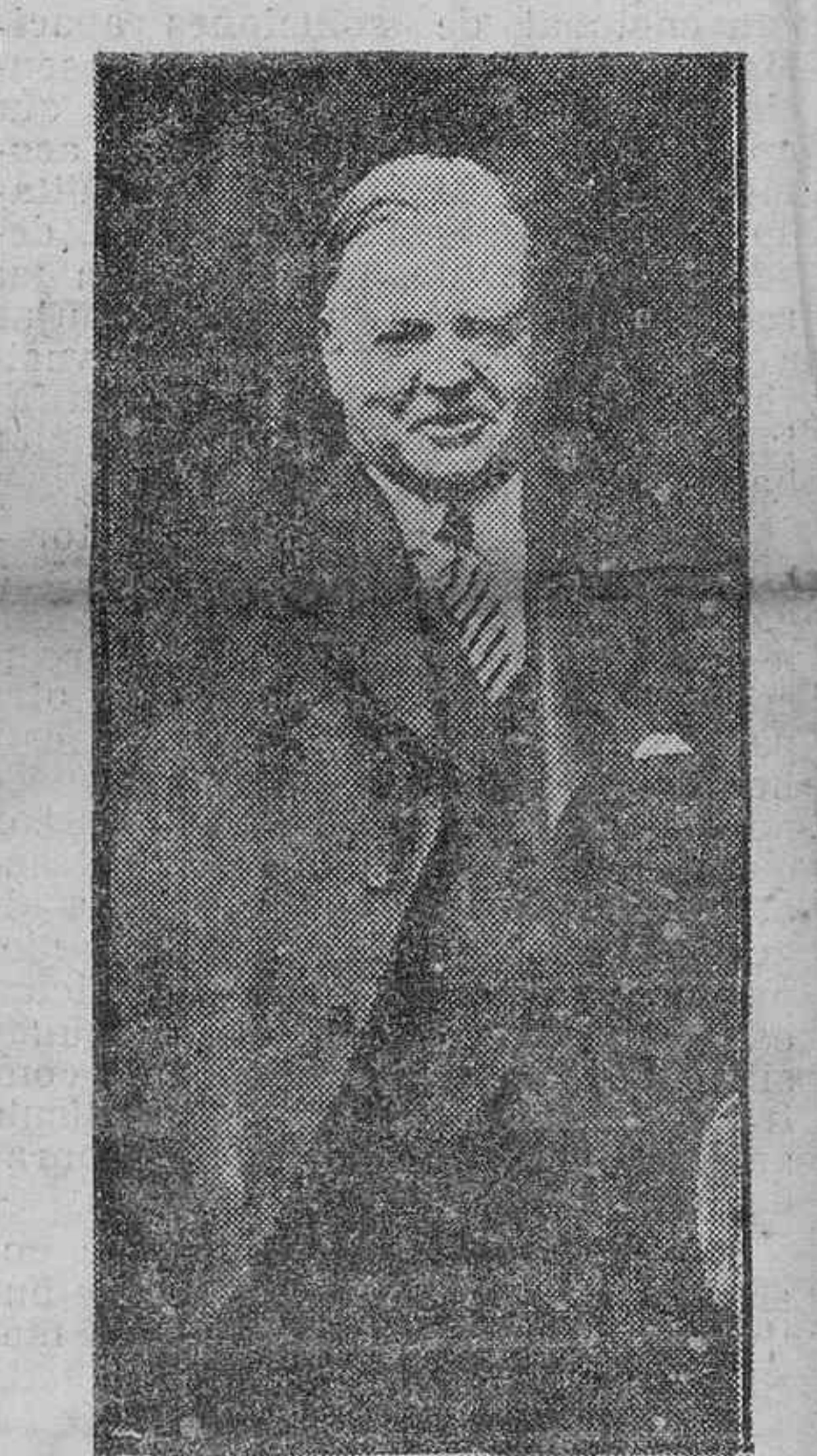
Hoover, presidente que cesó, derrotado por Roosevelt.

En 1921, cuando el gobernador Roosevelt tenía treinta y nueve años de edad, un ataque de parálisis infantil estuvo a punto de quitarle la vida. Completamente parafítico Roosevelt se hacía cada vez más a la idea de pasar el resto de sus días inmóvil en una butaca, cuando un mister Toy Loyless, a quien conoció por casualidad, le habló de la gran bondad de las aguas de Warm Springs, en el Estado de Georgia. Fué Roosevelt a Warm Springs, y al final de la primera temporada se hallaba tan mejorado que no dudó en hacer partícipes de su mejora a todos los que se encontraran en igual estado que él, a cuyo efecto invirtió las dos terceras partes de su fortuna en construir un sanatorio en Warm Springs, con la imposición administrativa de que solamente debe cubrir sus gastos; pero sin que pueda dejar utilidades.