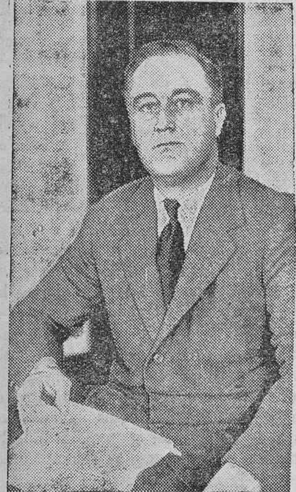
Roosevelt, nuevo presidente de los Estados Unidos

Ya desde muy joven, Roosevelt reveló poseer dotes extraordinarias y grandes facilidades polémicas. Durante sus estudios en Harvard, llegó a ser director del periódico de la