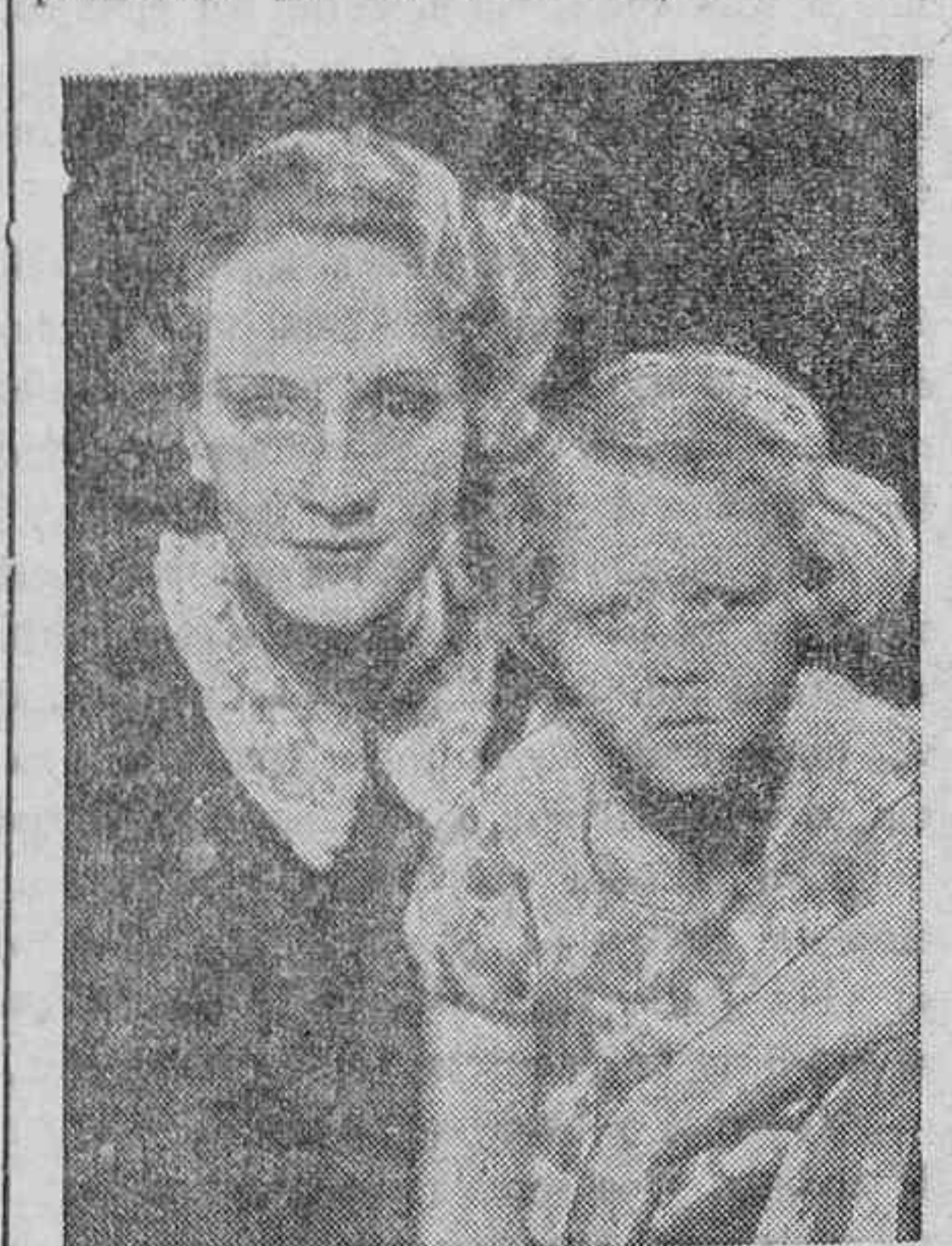
Un ídolo del público yanqui y en general de todos los públicos.

Es esa misma condición de mirada del público es responsable, hasta cierto punto, de lo que puede aconsejarle. No ha podido substraerse a los inconvenientes de una exagerada publicidad, y a la elevación vertiginosa con que fué exaltada a una posición envidiable. El resultado es que, actualmente, su vida no es vida. Suspira por lo que dejó en Europa y ha declarado que, tan pronto como termine su contrato en el próximo diciembre, se marchará a Europa y probablemente no regresará.