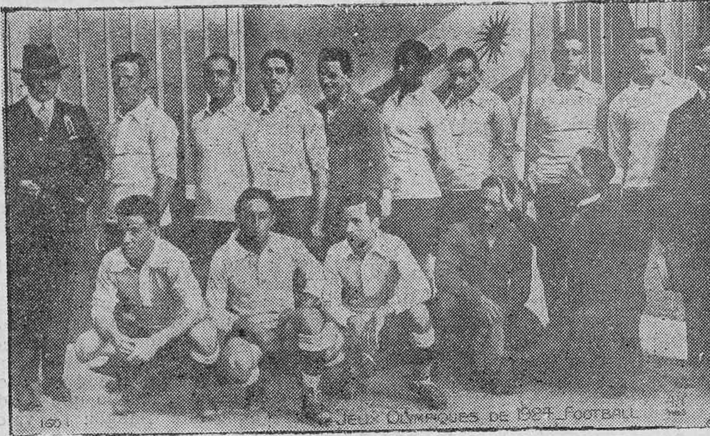
El equipo nacional del Uruguay, campeón del mundo, que ha sido invitado para jugar un partido en Londres con el equipo representativo de la Gran Bretaña