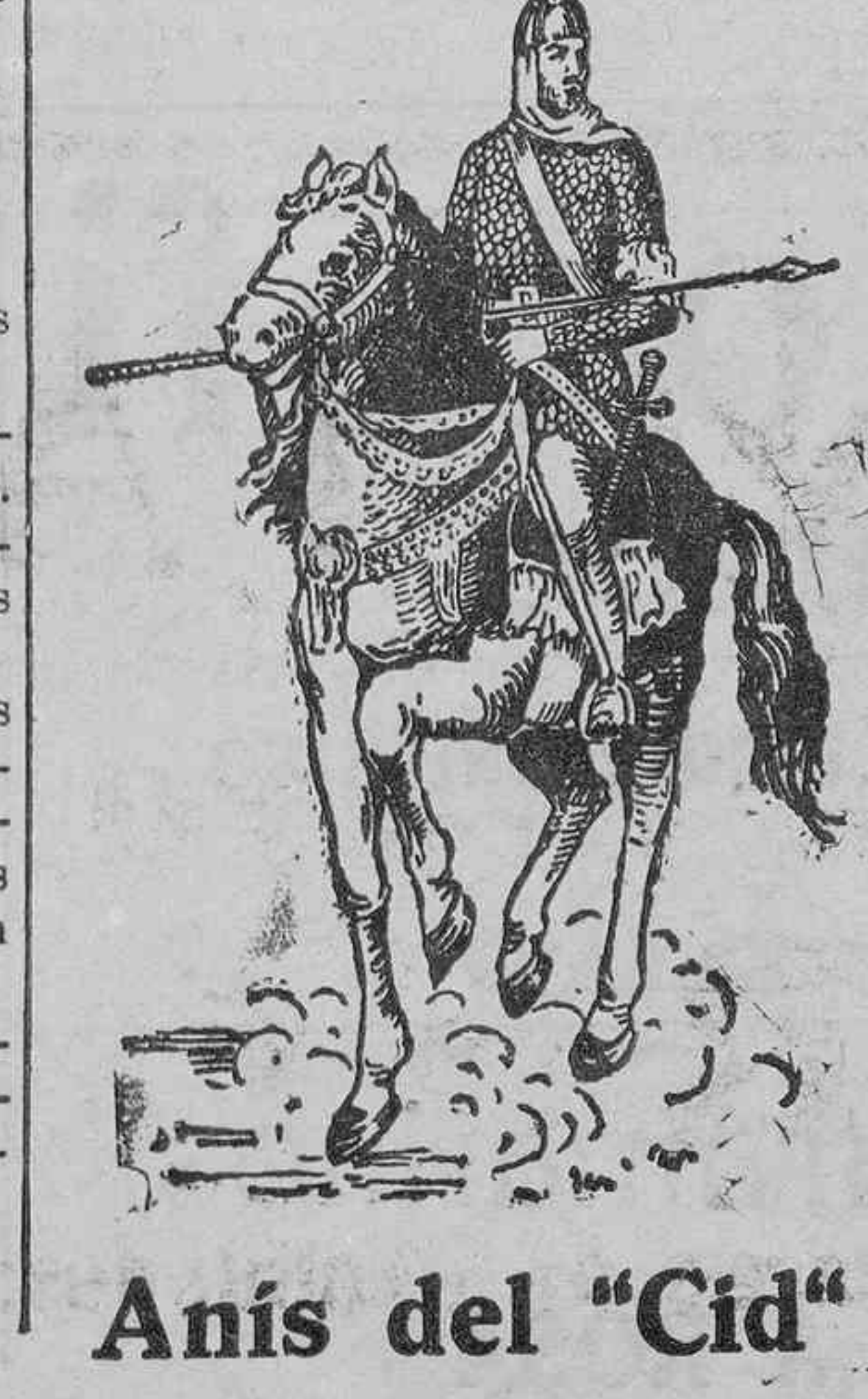
Anís del «Cid»