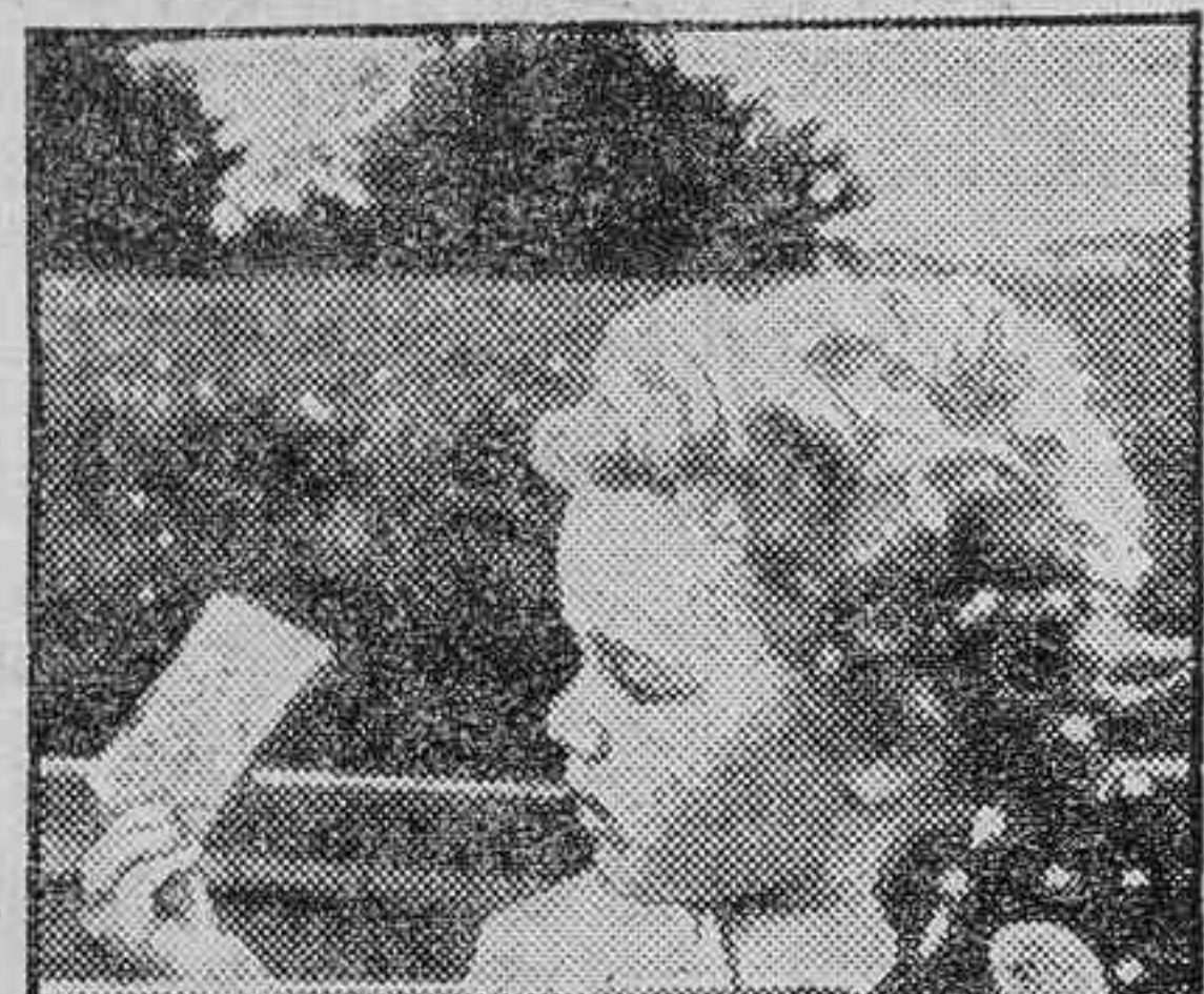
Las fotografías del niño de Lindbergh, hechas pocos días antes de su secuestro.