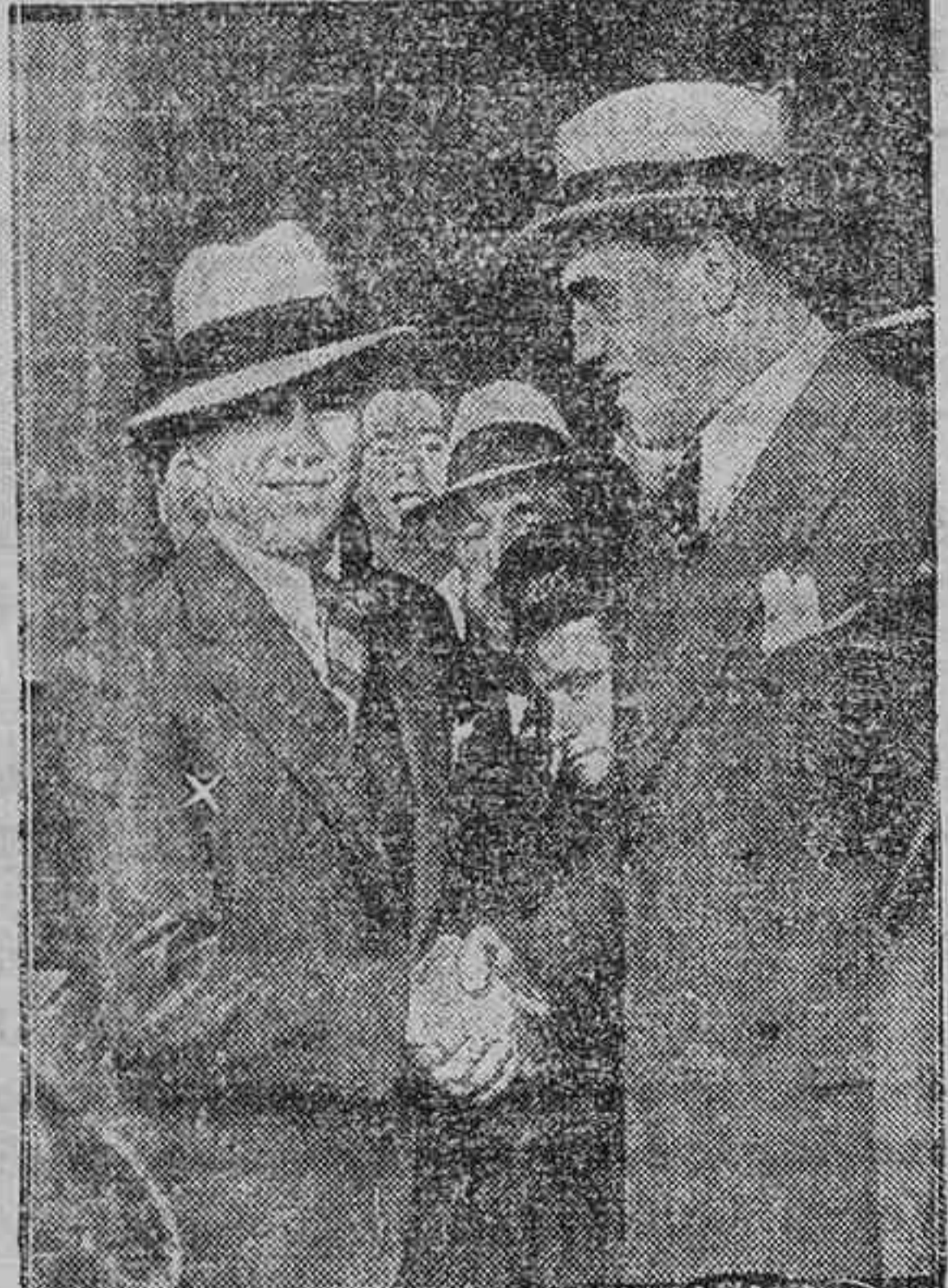
Max Schemeling (x), favorito en la pelea del martes, saluda por vez primera a Primo Carnera, el gigante italiano, venido recientemente en Londres por Larry Gains, boxeador negro

Los pronósticos son favorables al actual campeón, aunque los ameri-