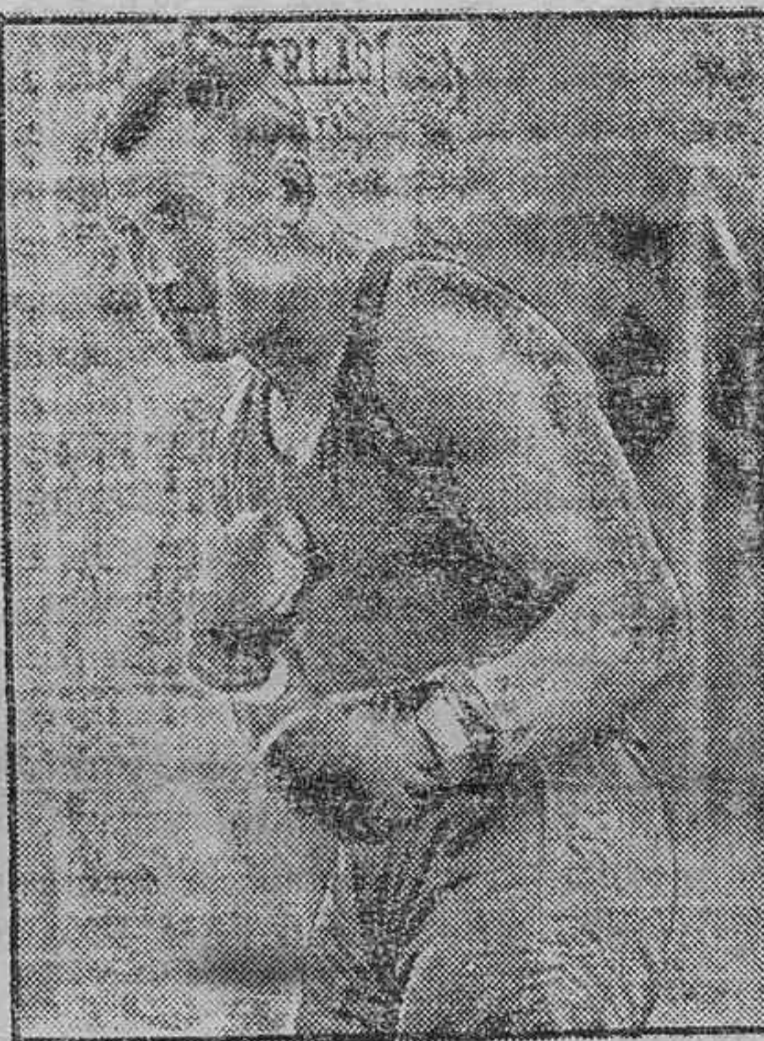
La guardia característica de Sharkey, en cuyos puños confían mucho los americanos ante el "match" con el campeón mundial

Hace unos días que me encontré con un hombre que empezó a hablar