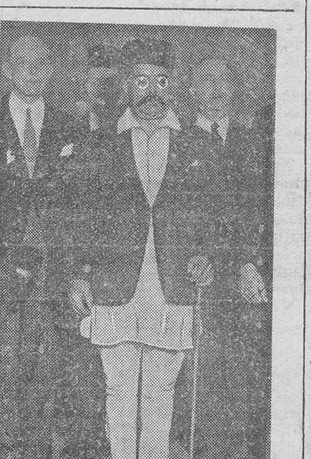
ACTUALIDAD GRAFICA.—El célebre jugador de "Rugby" Tom Sasaki, que se ha hecho construir un casco protector para prevenirse contra los frecuentes accidentes del juego, demasiado duro, a que se dedica.—Un encantador de ratas, a su paso por las calles de Hameln, atrayendo a los roedores al son de una flauta. Trátase de una costumbre legendaria que impera en aquel país desde hace 650 años.—El rey de Nepal, del Sur de Himalaya, que acaba de llegar a Roma, y que atrae la curiosidad de los transeúntes por su extraño indumento: smoking y pantalones blancos.