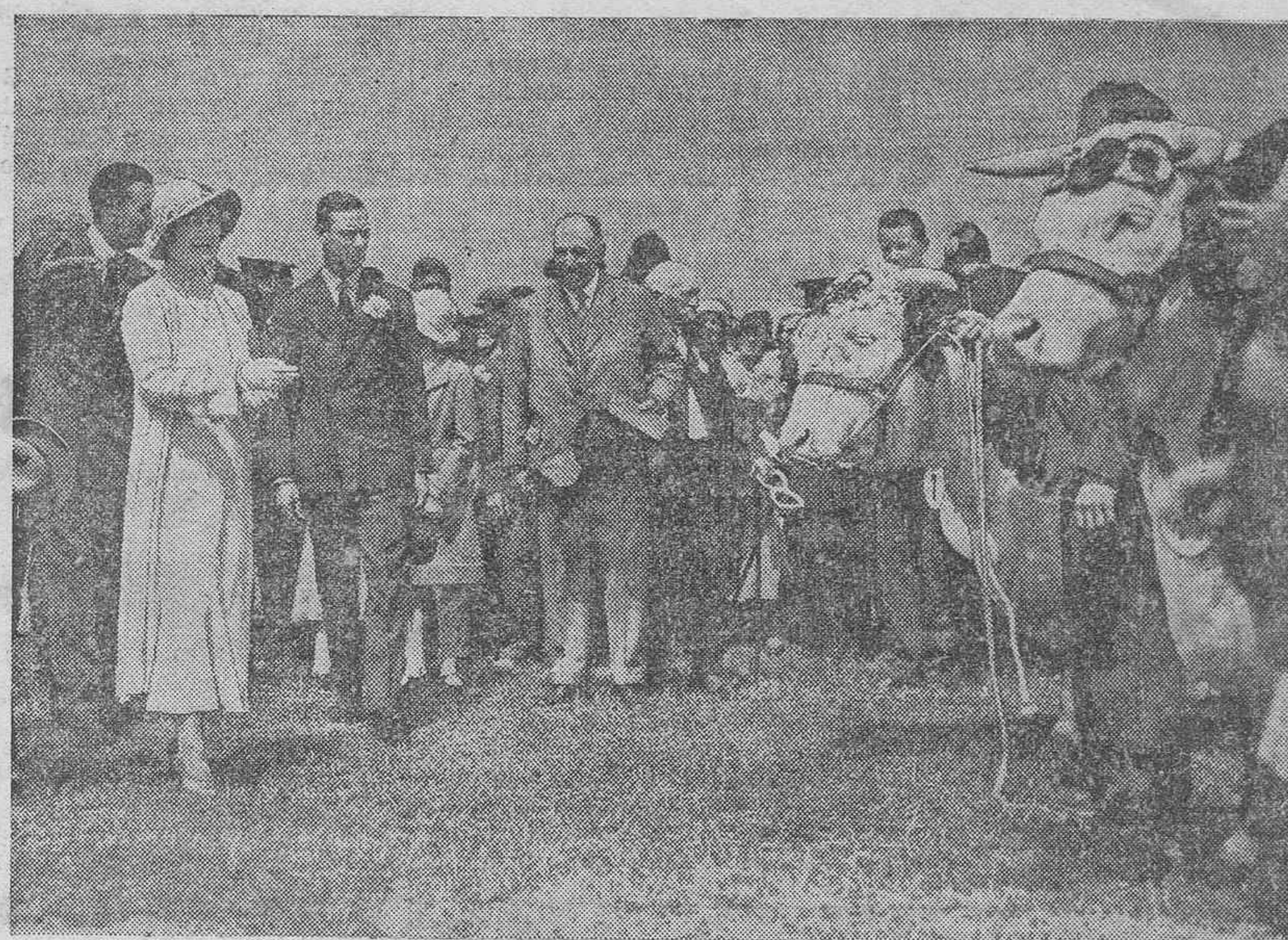
En Ipswich, condado de Suffolk, acaba de celebrarse la real feria de ganado, organizada por la Sociedad Agrícola de Inglaterra. Esta feria es una de las más grandes y más importantes de las 300 y pico exposiciones análogas que se celebran en Inglaterra durante los meses de verano; pero hace ya muchos años que la asistencia no era tan grande como la de este año, pues en los cuatro días que ha durado la feria se despacharon 107.000 billetes de entrada. Visitantes de Australia, de Nueva Zelandia y de los EE. UU. de América, compraron ovejas para la mejora de sus rebaños; agricultores polacos y suecos compraron cerdos de raza blanca grande; y grupos de agricultores de Dinamarca, de Holanda y de Bélgica, mostraron interés especial en las razas bovinas. El toro campeón Red Poll, y otro de la misma raza, fueron adquiridos por una importante ganadería de Australia

cada rama de deportes de verano. Comenzando con la captura del Campeonato Libre de Golf por un inglés, el señor Cotton, campeonato que han ganado durante tanto tiempo los jugadores norteamericanos que su invencibilidad había llegado a ser casi una superstición nacional, fué ganado en Wimbledon el campeonato de Tenis de hombres, mano a mano, por el brillante jugador inglés, señor Perry, tras una lucha emocionante con el formidable australiano señor Crawford. Al día siguiente el de mujeres, mano a mano, fué ganado por la señorita Dorothy Round, quien venció a la famosa campeona norteamericana, señorita Helen Jacobs.