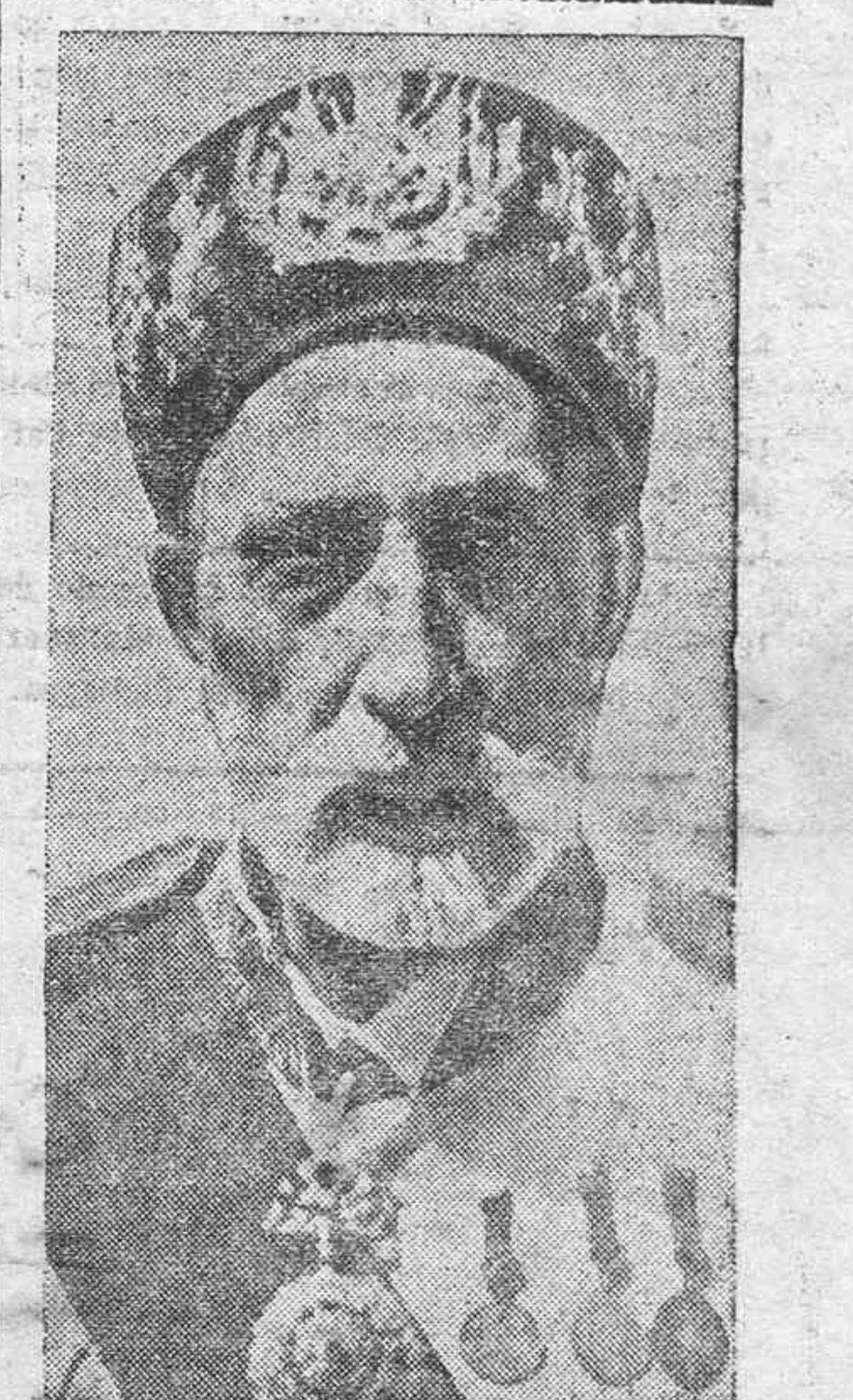
FIGURAS DEL DIA.—El rey de Túnez, que está siendo muy agasajado en París

Figuras del día.—El rey de Túnez, que está siendo muy agasajado en París.