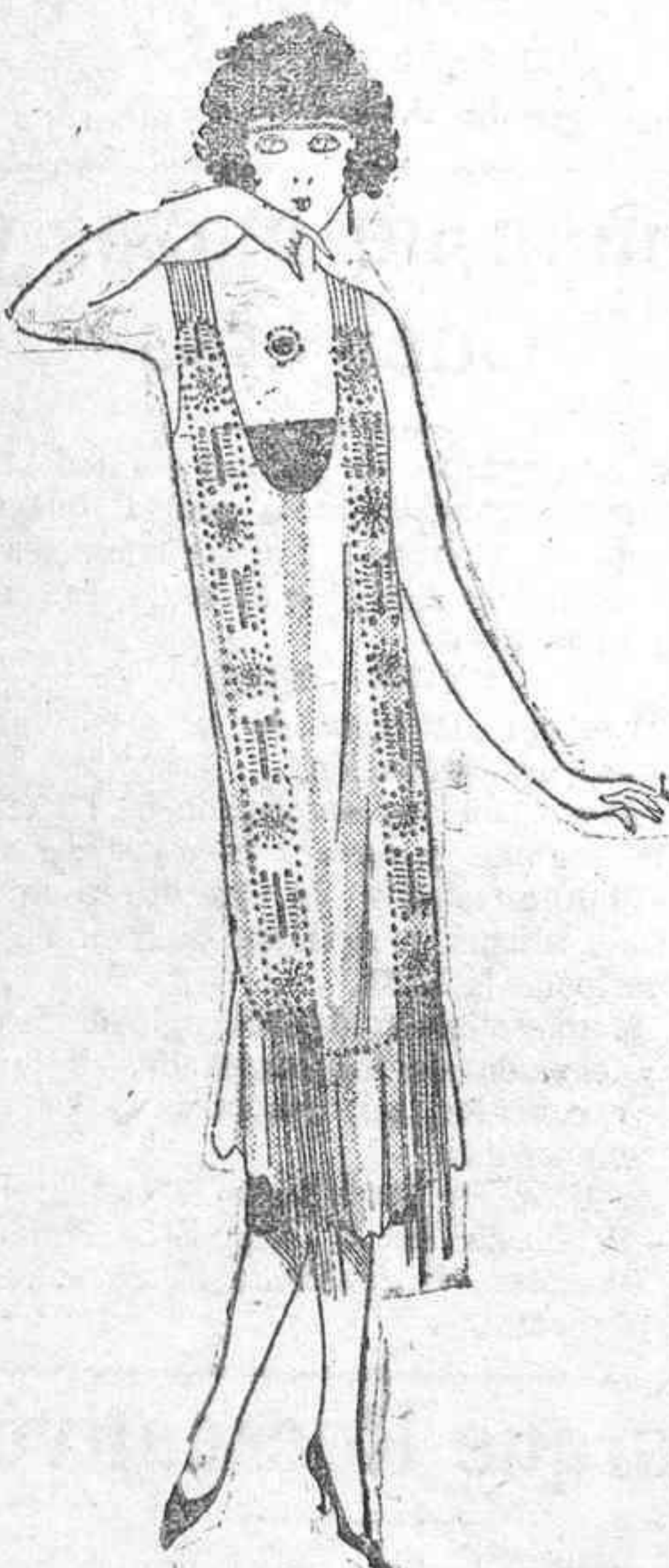
VESTIDO DE NOCHE

Otro detalle que hay que cuidar es el de las medias. No basta ya la media de seda transparente que ha inva-