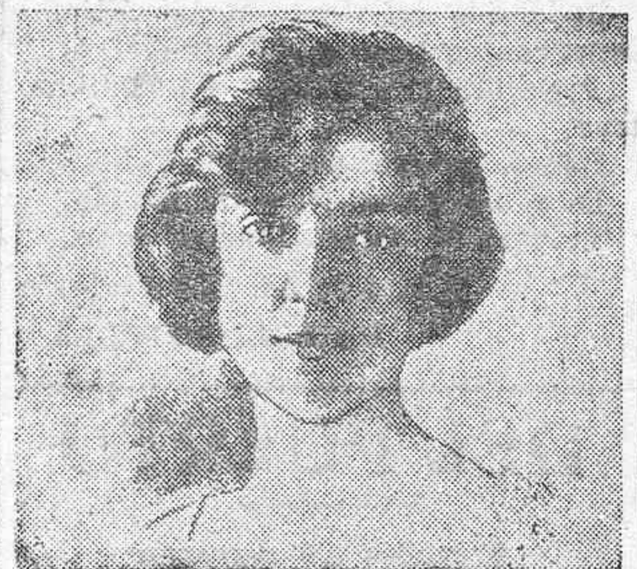
La ceremonia en el palacio Raconigi

El casamiento de la princesa Mafalda con el príncipe Felipe de Hesse ha revestido extraordinaria solemnidad. Después del matrimonio oficial se celebró la ceremonia eclesiástica, en una capilla del castillo. La capilla estaba decorada con colgaduras de terciopelo rojo. Los esposos, los testigos y los reyes tomaron asiento en el estrado, al lado del altar, y los invitados, en tribunas especialmente construidas.