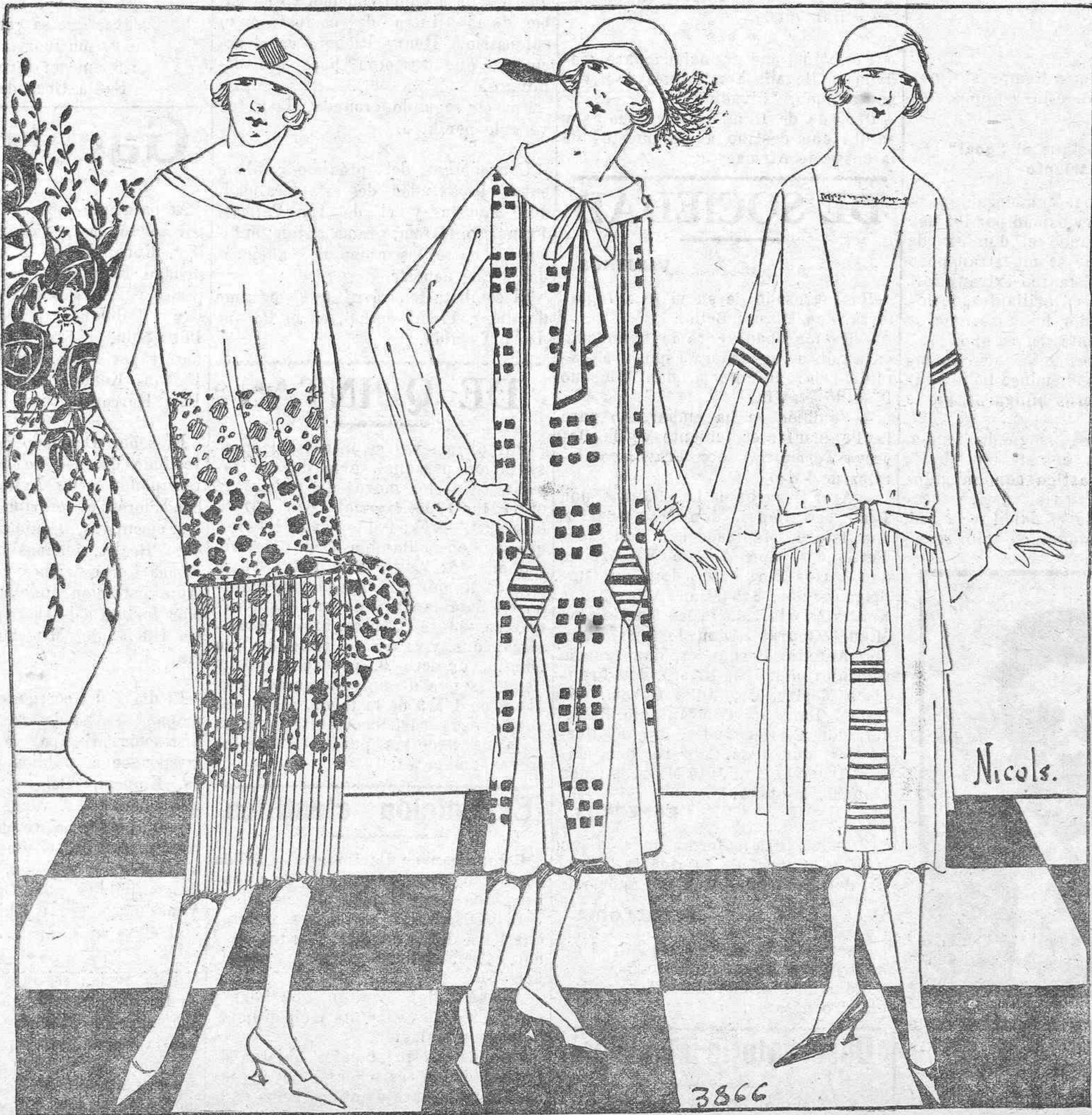
PANORAMA. Vestidos para teatro

He aquí, en esta figura, un vestido de noche, cuyo «fourreau» es en fulgurante mandarina. Paños de tul plateado con adornos en rosas de terciopelo mandarina.