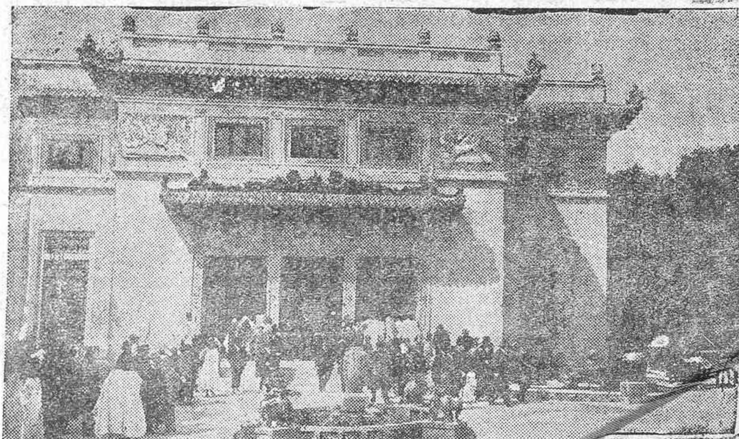
El pabellón de la Indo China en la Exposición que actualmente se celebra en París

Habrà cantina con abundantes provisiones; puestos servidos por bellas señoritas y atractivos y regocijos para todos los gustos.