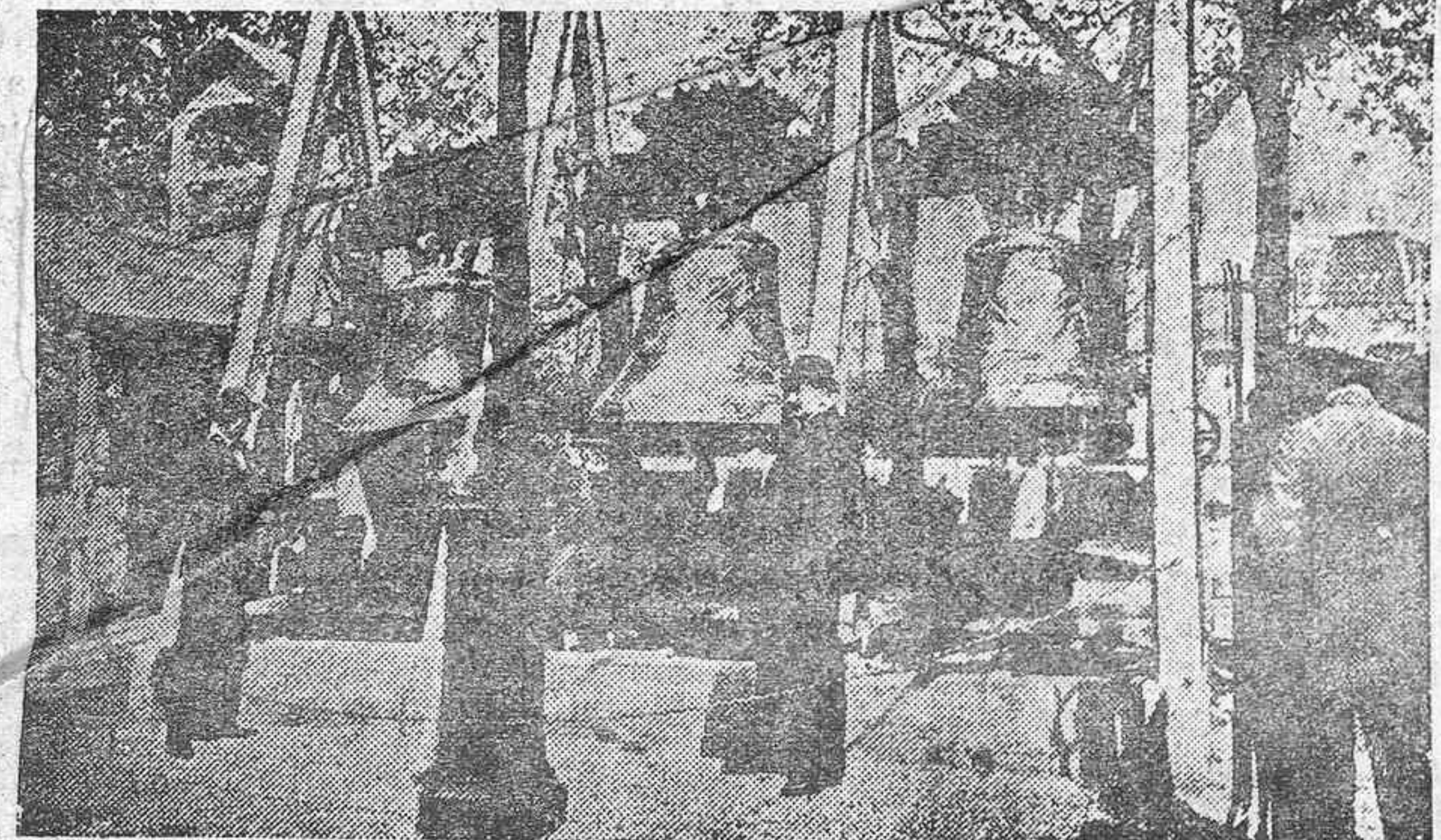
Las tres campanas de la Exposición pertenecientes a tres iglesias de las regiones liberadas

A las 4 en punto, saldrá procesionalmente la Cruz en dirección al Casino "Primer de Enero". Frente al mismo, hará un deseano, pronunciándose en este acto una oración