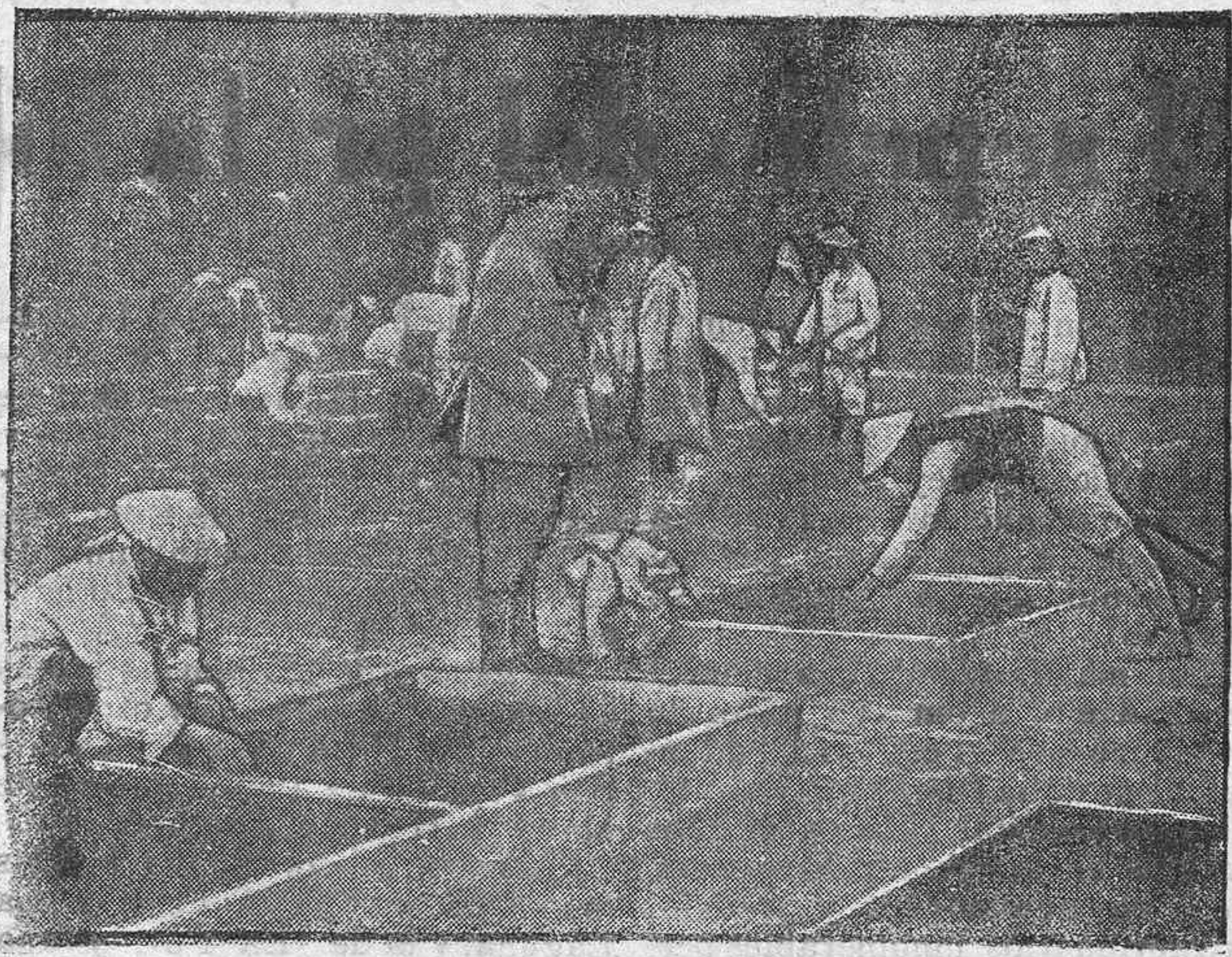
TIRADORES ANNAMITAS CULTIVANDO LAS TIERRAS EN LOS ALREDEDORES DE PARIS

Mañana seguiremos relatando nuestras impresiones de viaje; exponiendo los deseos y las necesidades que en estos pueblos nos han expresado; sus mejoras locales, y el estado de su riqueza forestal, el más bello y atrayente ornato con que cuenta esta región, llamada a ser un centro de gran vitalidad, de pujantes energías, con un amplio espíritu de renovación y de progreso.