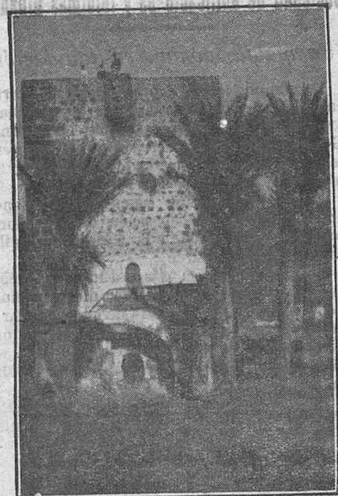
LA FAMOSA "TORRE DEL CONDE", CONSTRUIDA EN 1740 POR HERNAN PERAZA