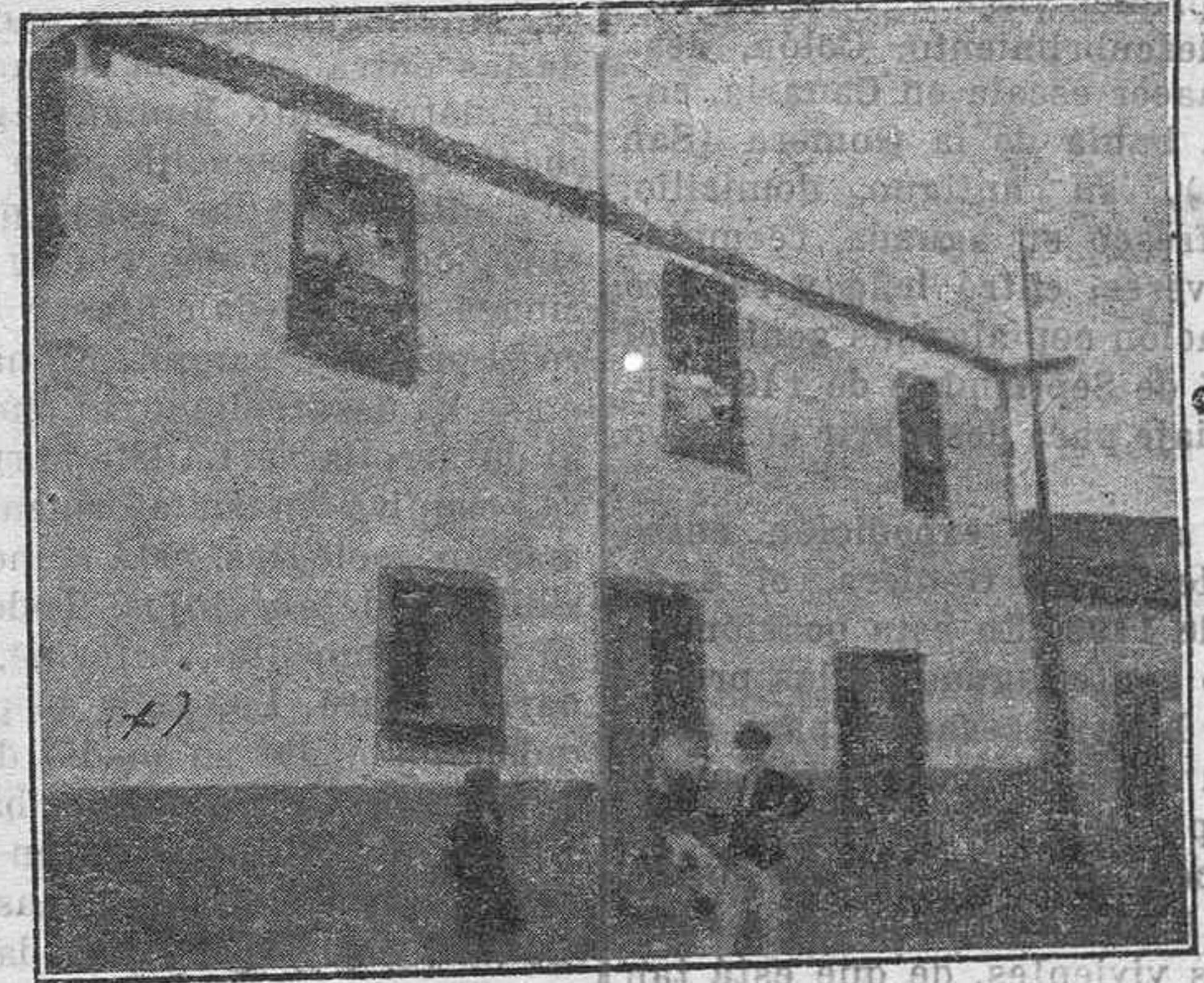
CASA QUE HABITO CRISTOBAL COLON A SU PASO POR SAN SEBASTIAN EN SU PRIMER VIAJE A AMERICA

En 1808 obtuvo del papa la secularización y emprendió un viaje por Francia e Italia, regresando a España en 1810, cuando hallábase en todo su apogeo la guerra de la Independencia. Encontróse a su llegada con que se había sacado a oposición la silla "abacial" de Villamartín de Val-