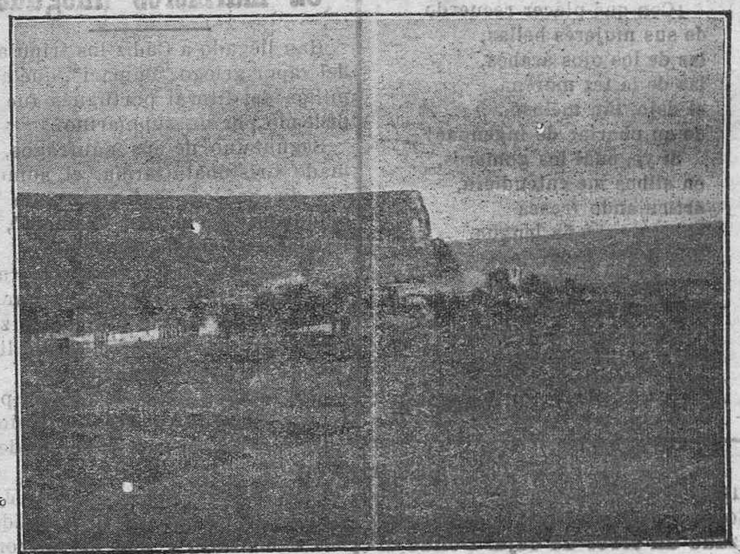
SAN SEBASTIAN VISTO DESDE LAS AFUERAS

Confío—no sé si mi optimismo sufrirá otro desengaño—en que, con el nuevo personal que va ahora a esa Jefatura, marchen los estudios de obras públicas y que dentro de este año, pueda ponerse en ejecución el segundo y quinto trozo de la carretera de la Gomera. Veremos si lo consigo.