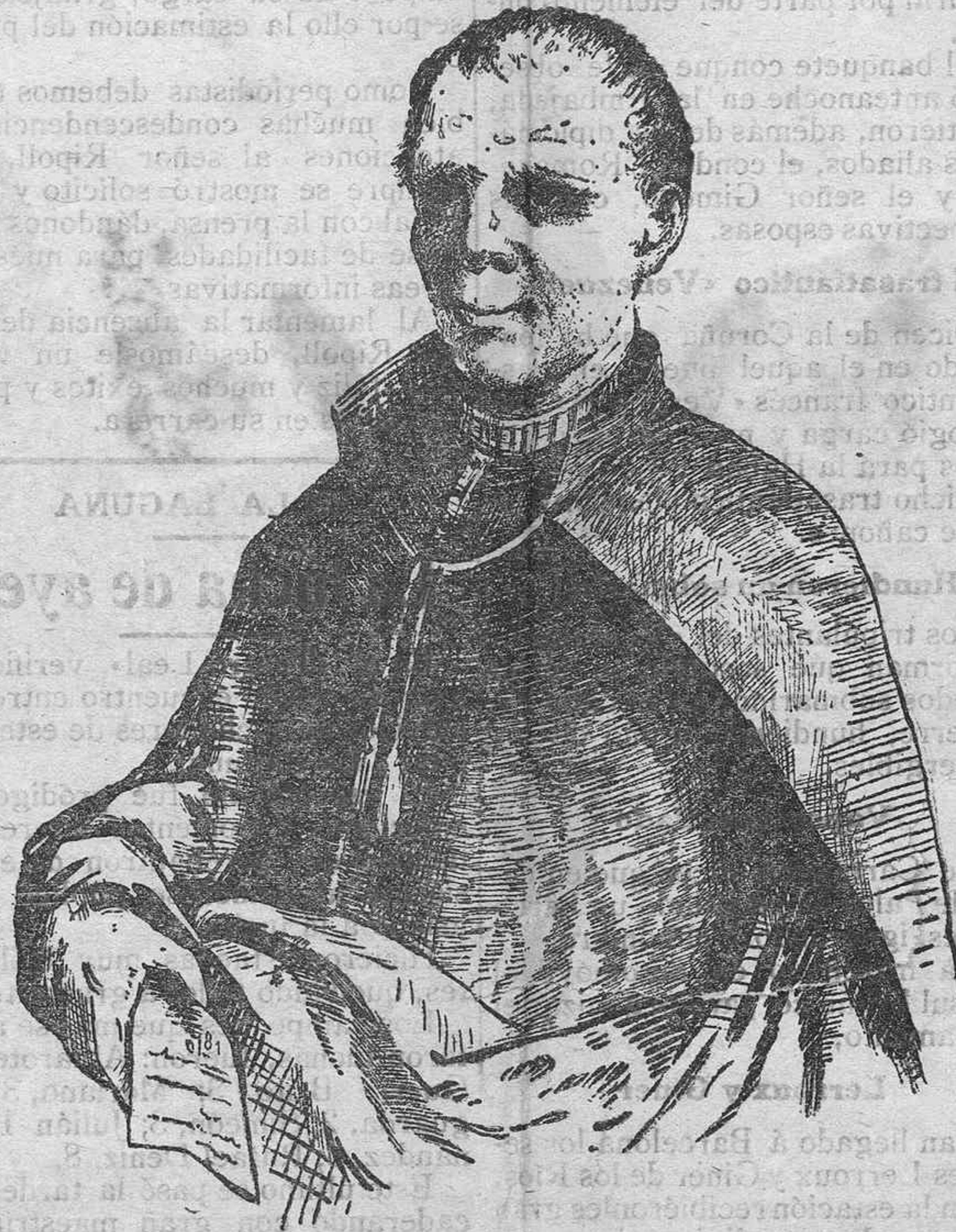
EL CELEBRE SACERDOTE RUIZ DE PADRON, NATURAL DE SAN SEBASTIAN DE LA GOMERA

Los fabulosos precios que alcanzaban antes de la actual guerra europea, los tomates y plátanos, principal riqueza, como ya se ha dicho, de la isla, hacían que la villa de San Sebastián de la Gomera fuese un pueblo de vida próspera, que avanzaba rápidamente en el camino del progreso. Por triste contraste, su situación actual no puede ser más angustiosa, pues paradas estas dos fuentes de riqueza, los propietarios han experimentado grandes pérdidas, la clase obrera carece de trabajo, el comercio se ha resentido, y la vida se ha hecho difícil.