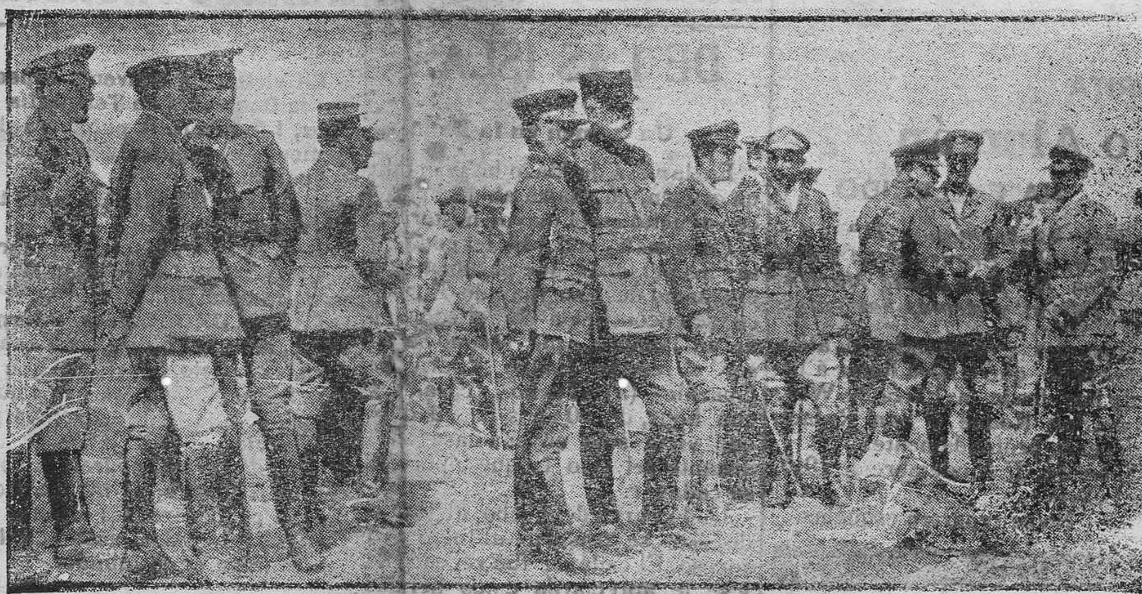
EJERCITO DE ORIENTE.—El general Serrail examinando las posesiones de Macedonia.

En Tenerife estamos obligados a responder al llamamiento que nos hace el Centro de propaganda para fines tan útiles como los que se propone realizar.