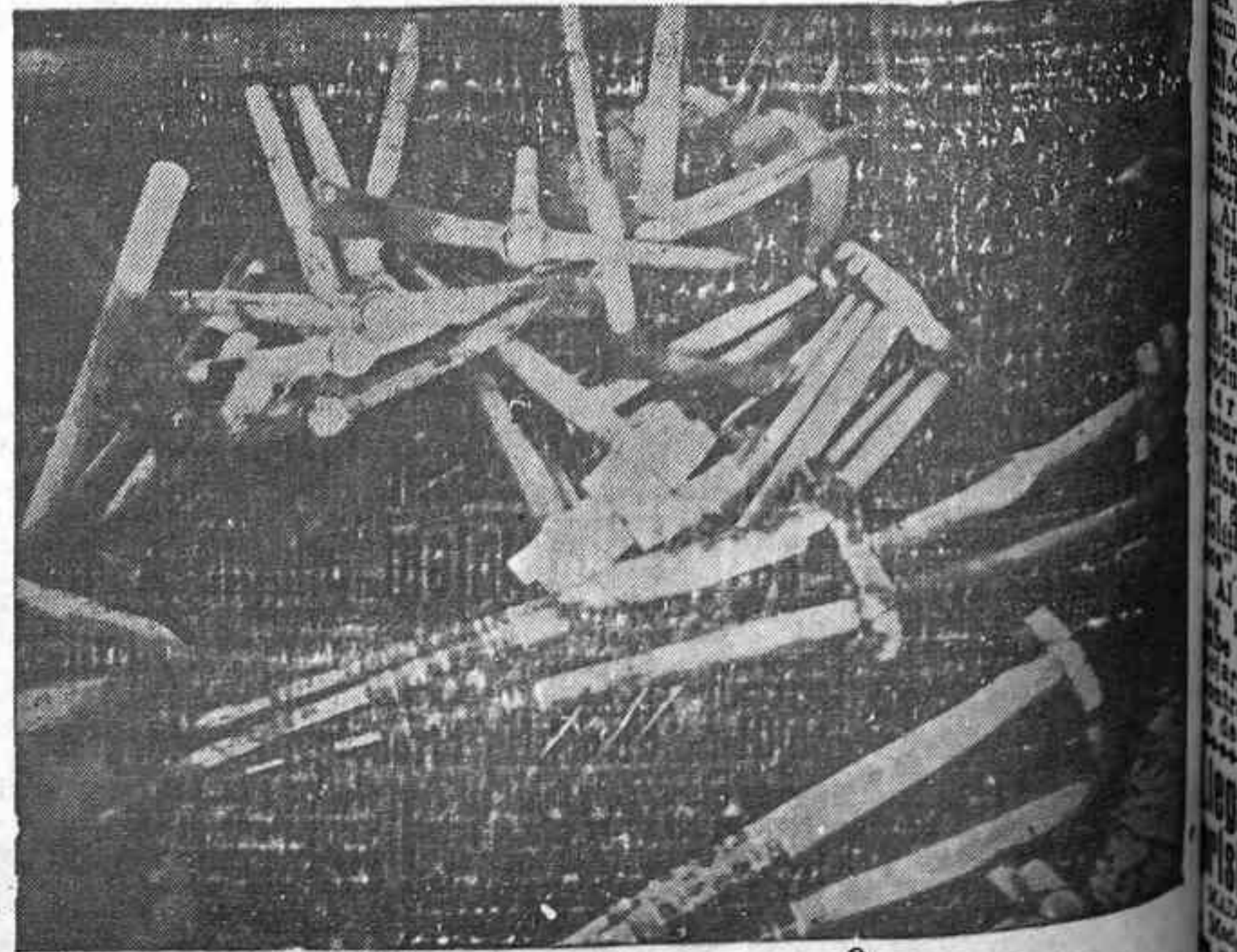
MATERIAL DE GUERRA — Tan preciso y tan preciso como el otro

LONDRES, 26.— Hoy entró en Valencia con destino a Inglaterra el defensor de los intereses británicos en España, quien se dispuso a una emotiva despedida, acudiendo al acto diversas personalidades y funcionarios de la Embajada inglesa.