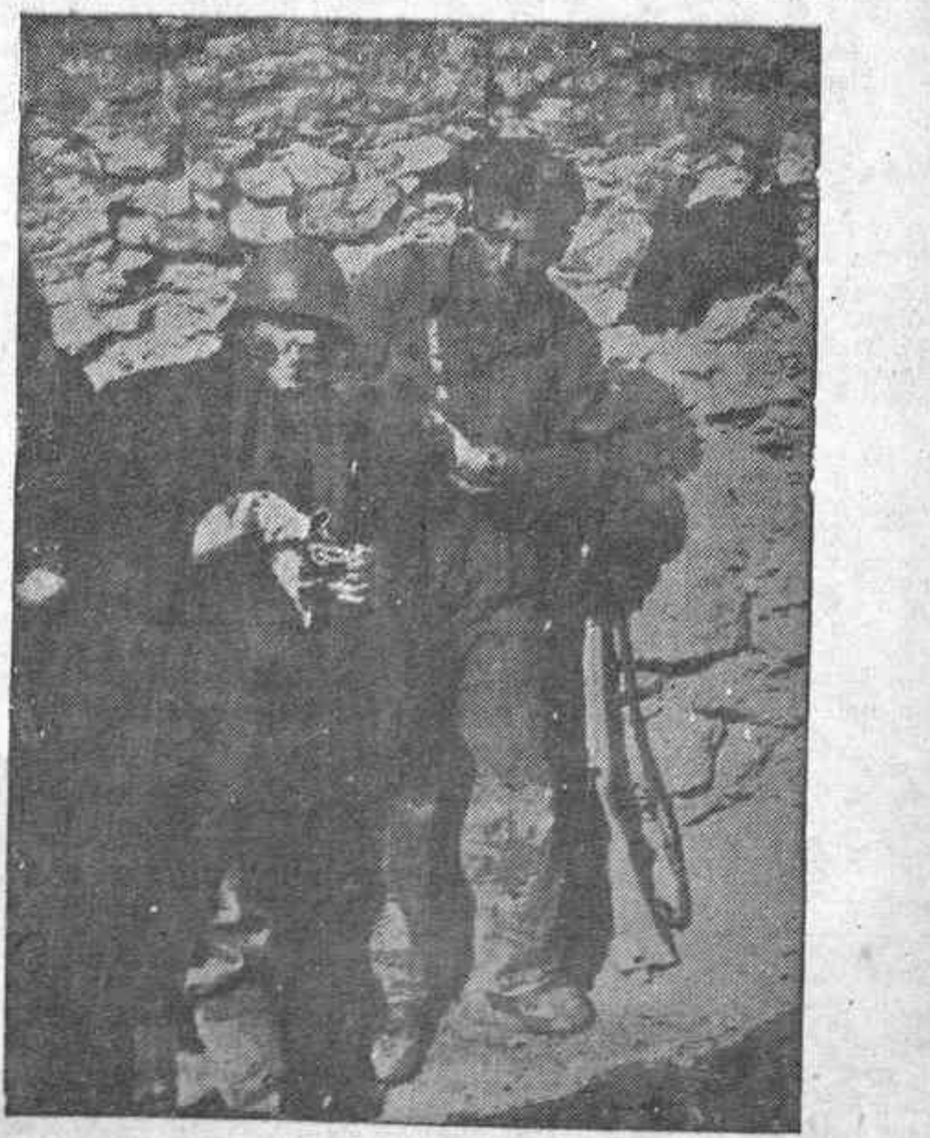
Acaban de herirle. Por el negro boquete que se ve a la derecha una bala fascista le ha cogido la cara. Por fortuna no es grave el percance

TOKIO, 26.—El ministro de Negocios Extranjeros, Sadko, ha pronunciado un importante discurso en la Dieta afirmando que el Japón no tiene la menor intención de devolver a Alemania sus antiguas colonias del Pacífico.