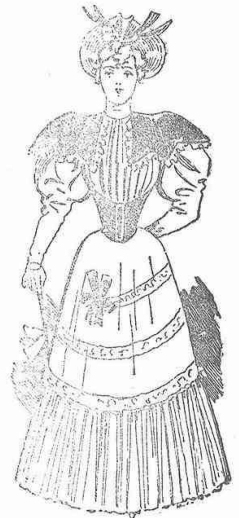
Traje de visita

Las mangas anchas y bullonadas, sujétanse más arriba del codo, como podrá verse en el figurín.