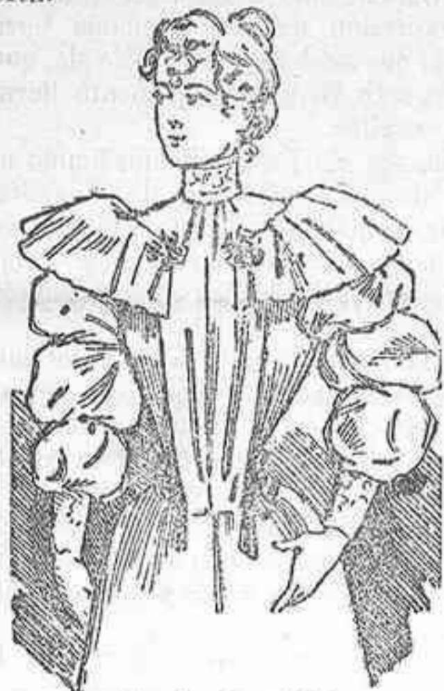
Traje de calle

Traje de calle.—Blusa negligé.—Vestido fantasia.—Traje de visita.