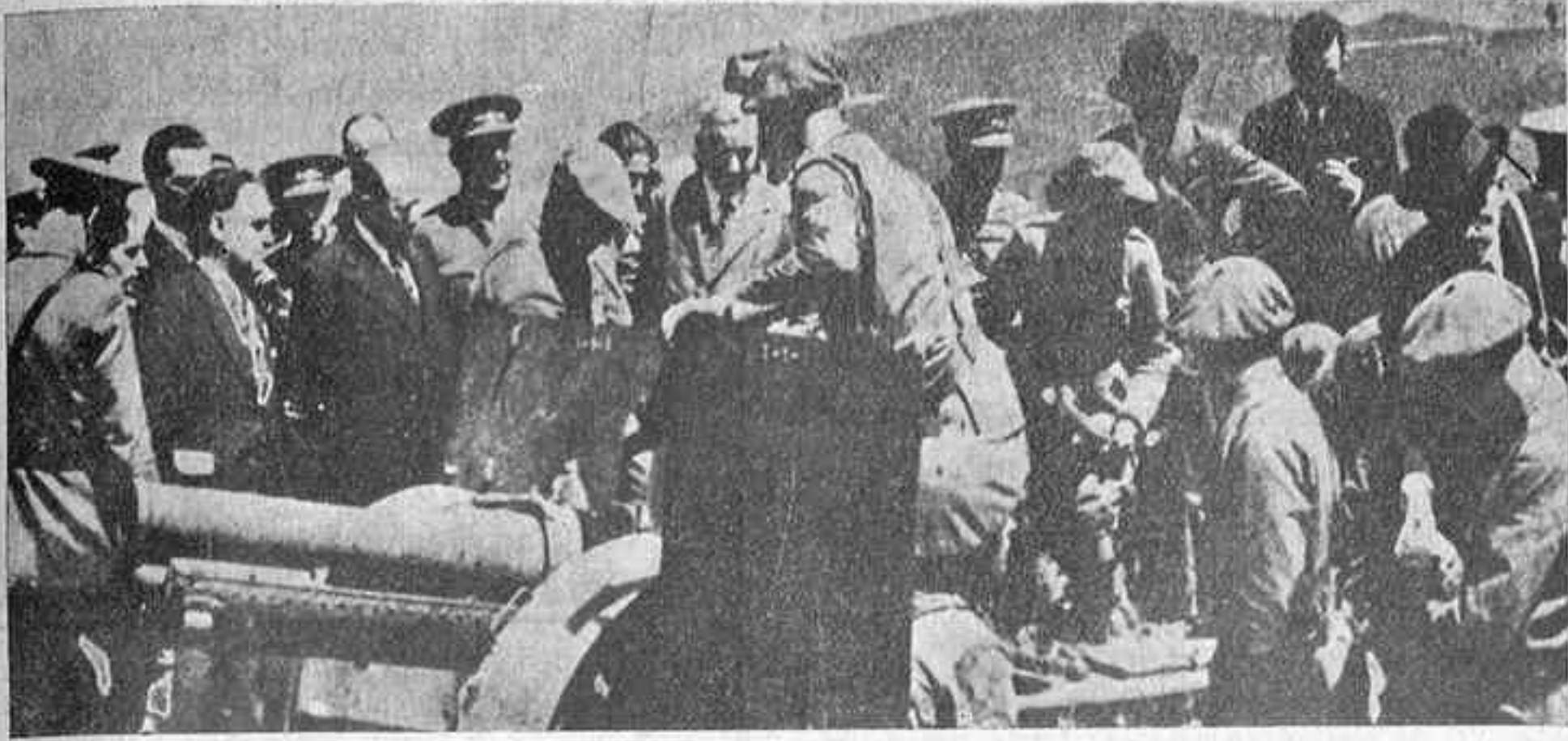
El ministro de la Guerra con el alto mando examinando el material de artillería en las brillantes maniobras militares de Riosa.

El público arracimado en los balcones, y en la calle desbordando a la fuerza pública, aplaude al Ejército, culminando su entusiasmo al cruzar el Tercio, con su marcha rápida, enérgica y briosa, que da nota de su técnica militar, al cabo de una jornada de prueba.