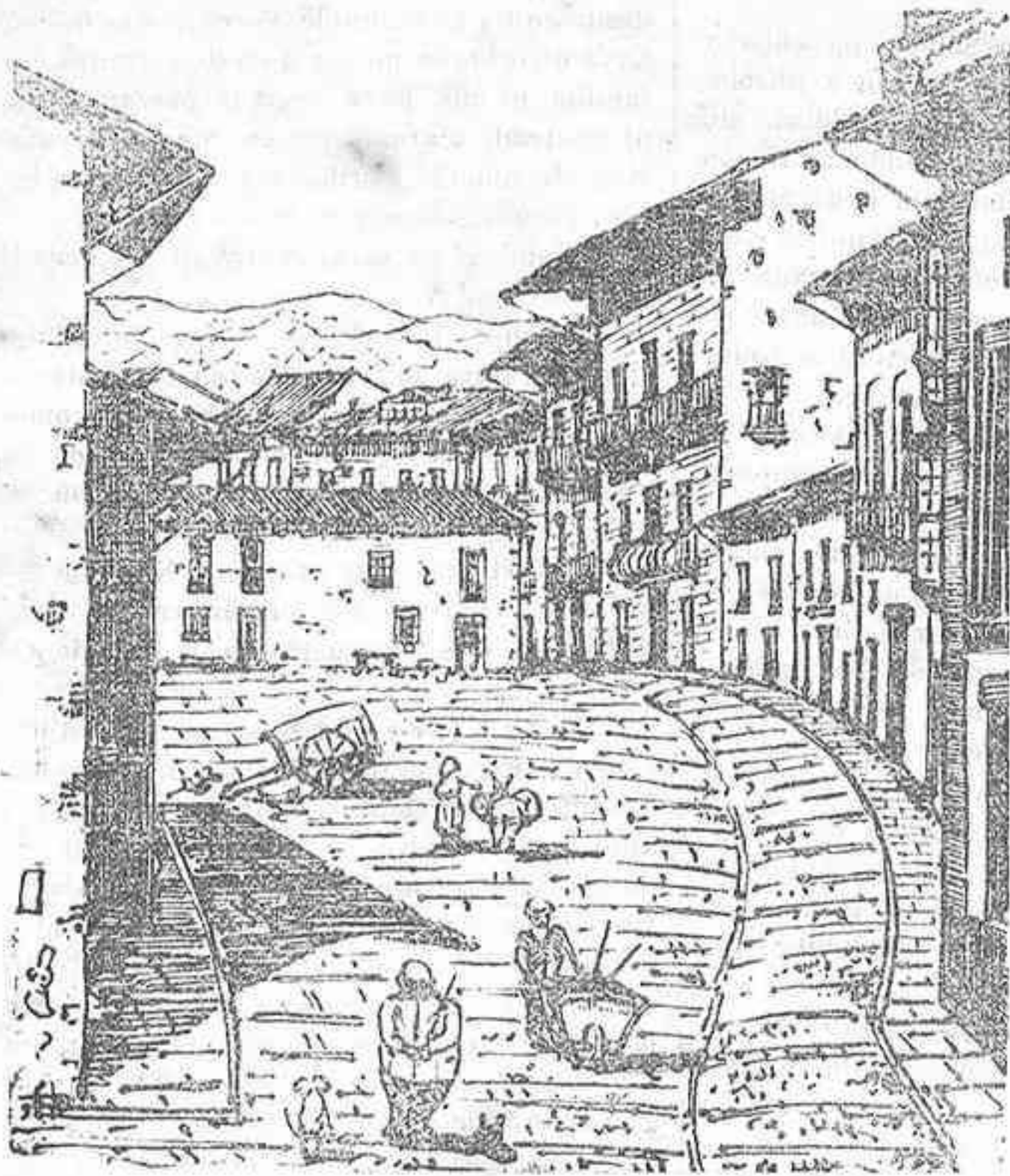
Calle del Sol antes del derribo de la casa de Miyar.

Una de las mejoras más importantes llevadas á cabo en Villaviciosa en los últimos tiempos, fué la reforma de la calle del Sol, en la parte más céntrica y principal de dicha vía. Ved lo que era hace diez años la citada calle: