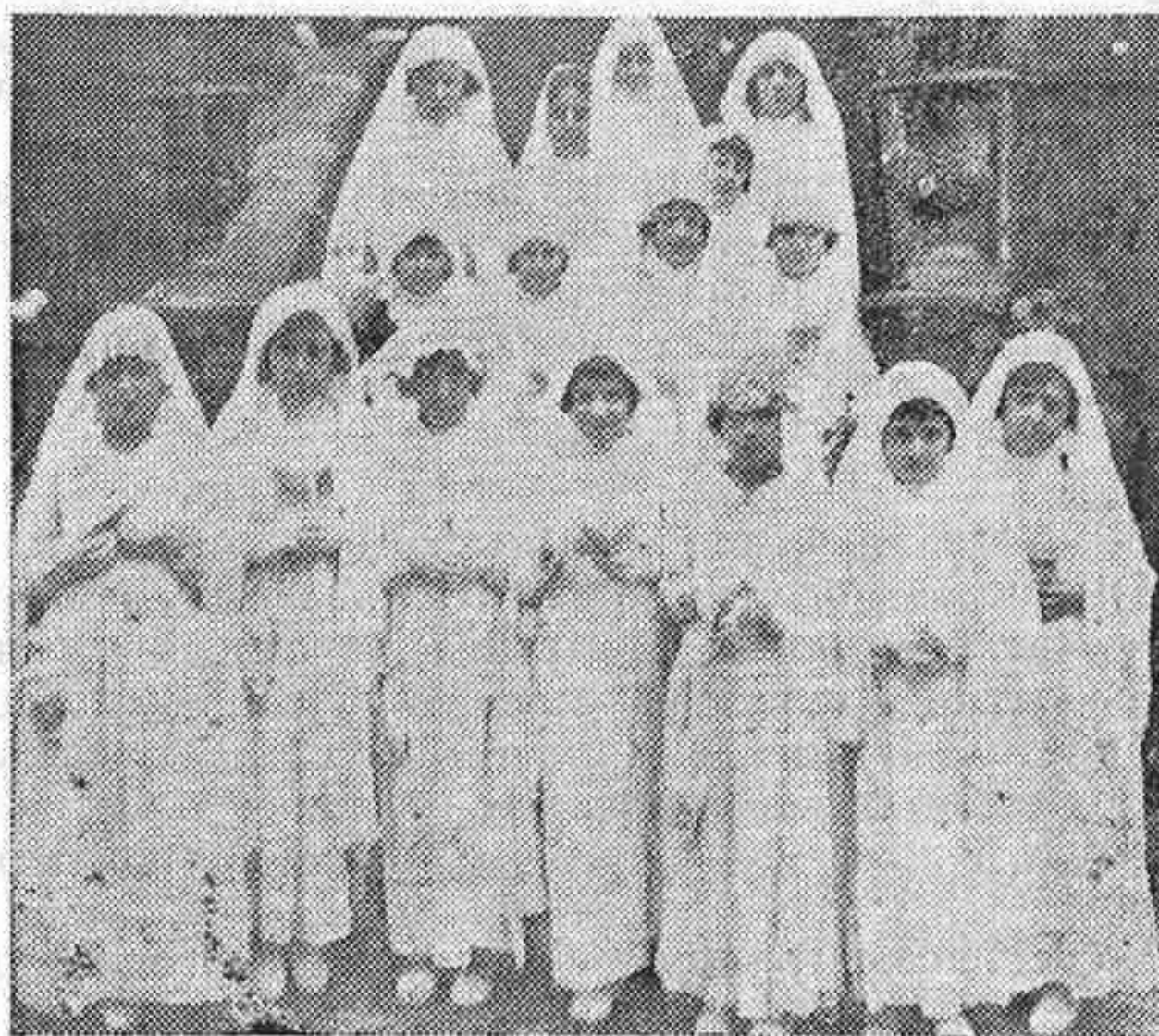
Grupo de niñas del Catecismo Parroquial de San Lorenzo que hicieron la primera comunión el pasado domingo.

5) En un día oportuno se dará la comida a los pobres, servida por socias que a ello se ofrecen voluntariamente.