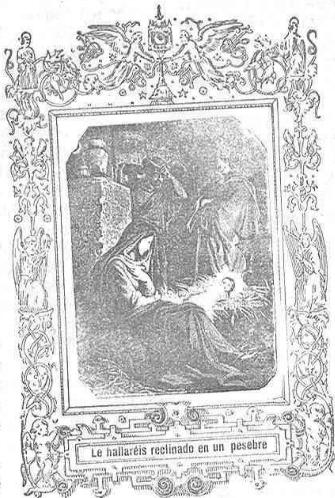
Le hallaréis reclinado en un pesebre

Y paz ha habido en verdad siempre que los hombres han tenido buena voluntad y han vuelto los ojos a este Salvador siguiendo fielmente sus doctrinas; como ha huido la paz y el bienestar siempre que se han apartado de ellas.