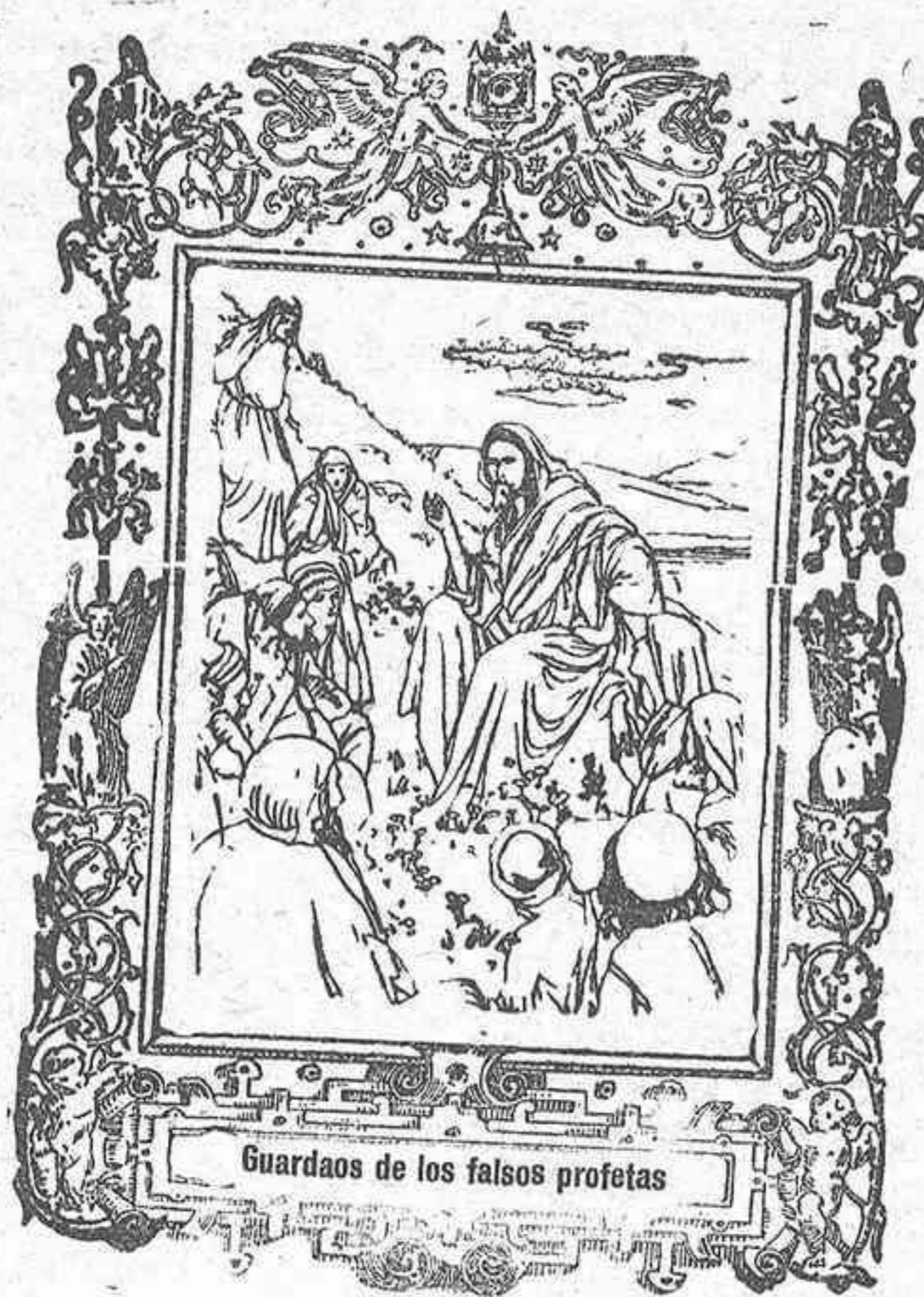
Guardaos de los falsos profetas

En verdad, ¿qué mayores ladrones que los que intentaron robarnos la fe y la gracia de Dios? ¿Qué mayores criminales que los que nos matan el alma y nos acarrearán la muerte eterna? ¡Huyamos de ellos!