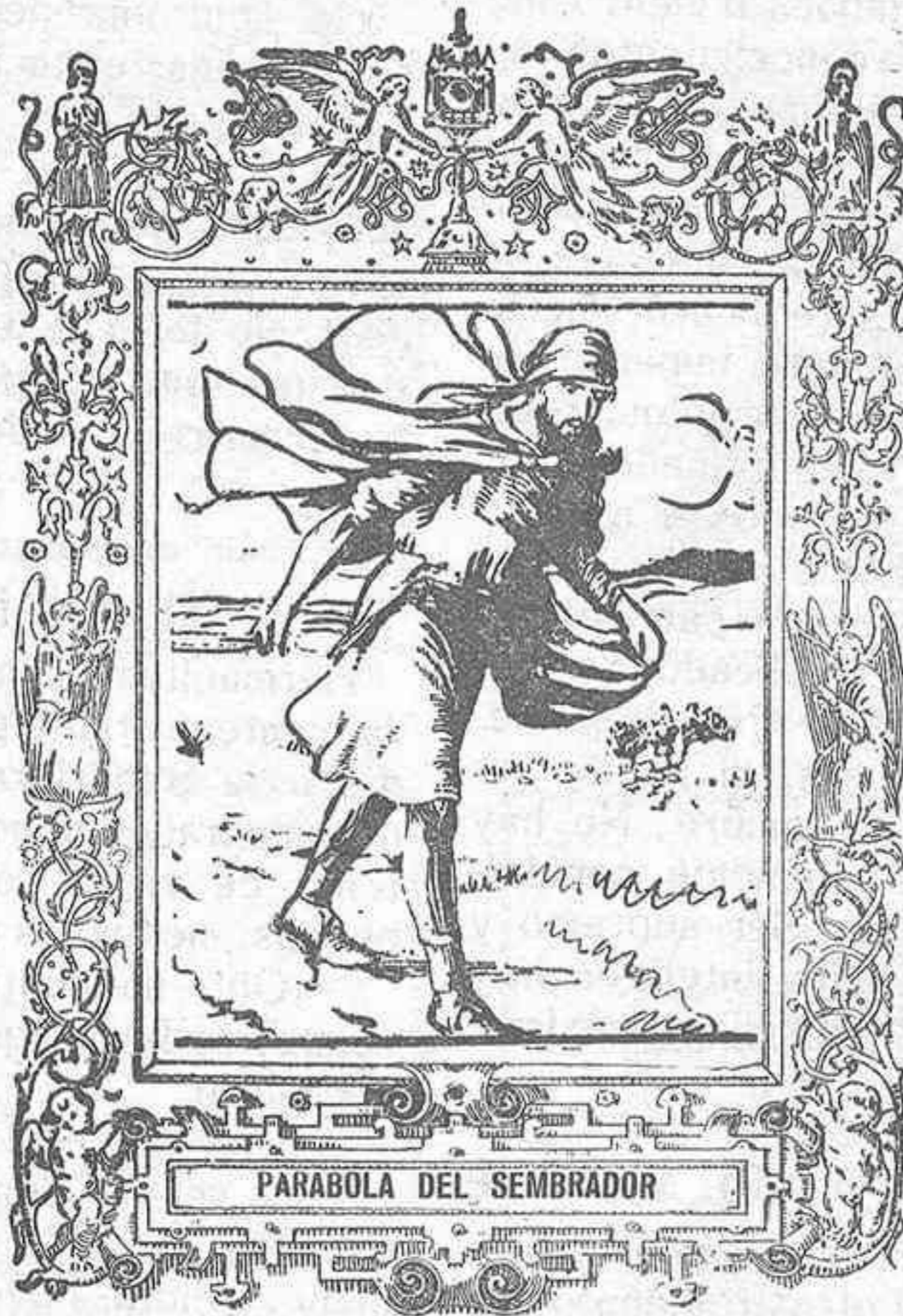
PARABOLA DEL SEMBRADOR

Cizana son los cines y otros espectáculos, casi siempre más o menos inmorales, que frecuentan los niños más que las iglesias, perdiendo así también poco a poco su inocencia.