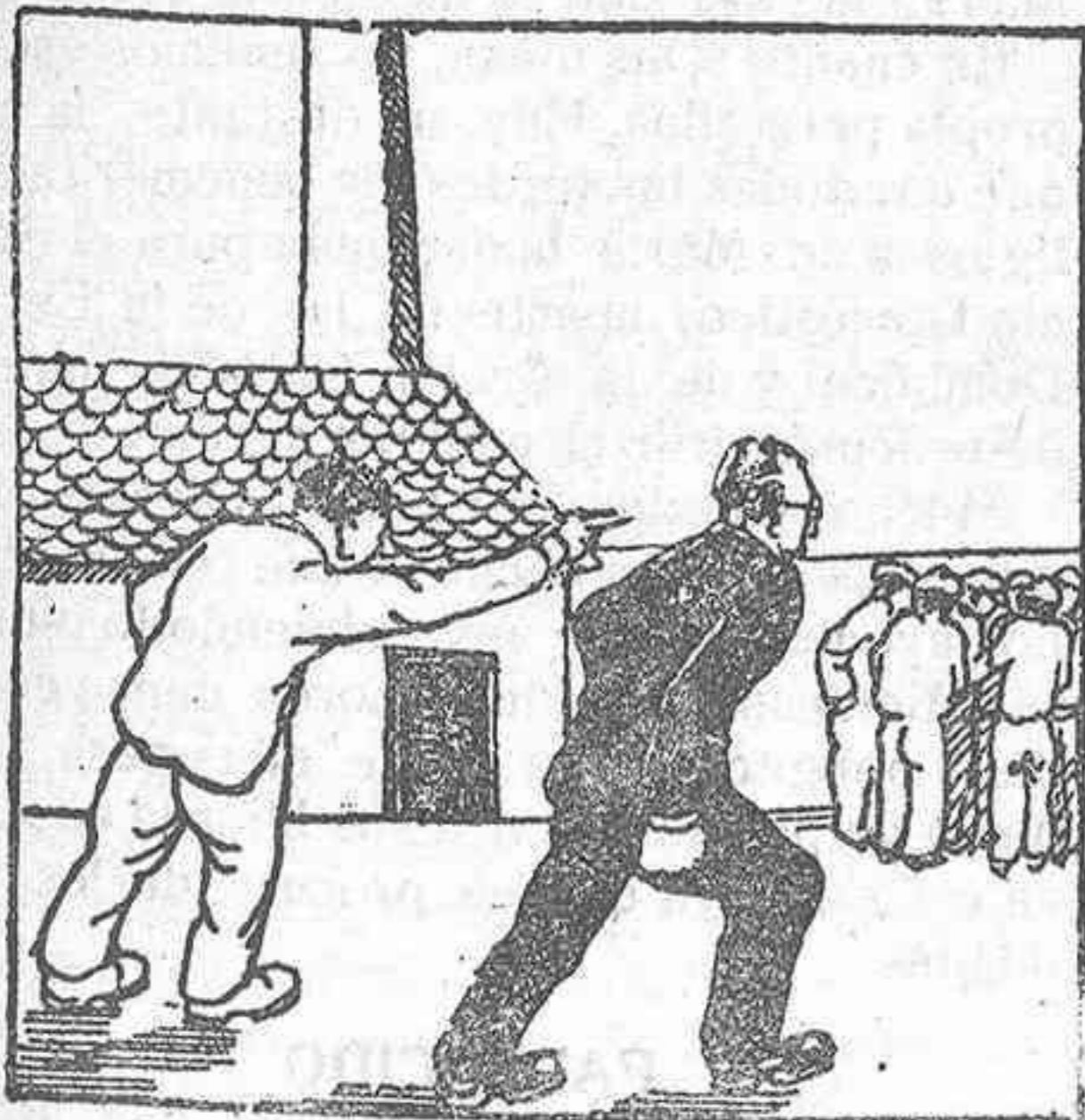
— Mire, mire: acérquese allá y lo verá.