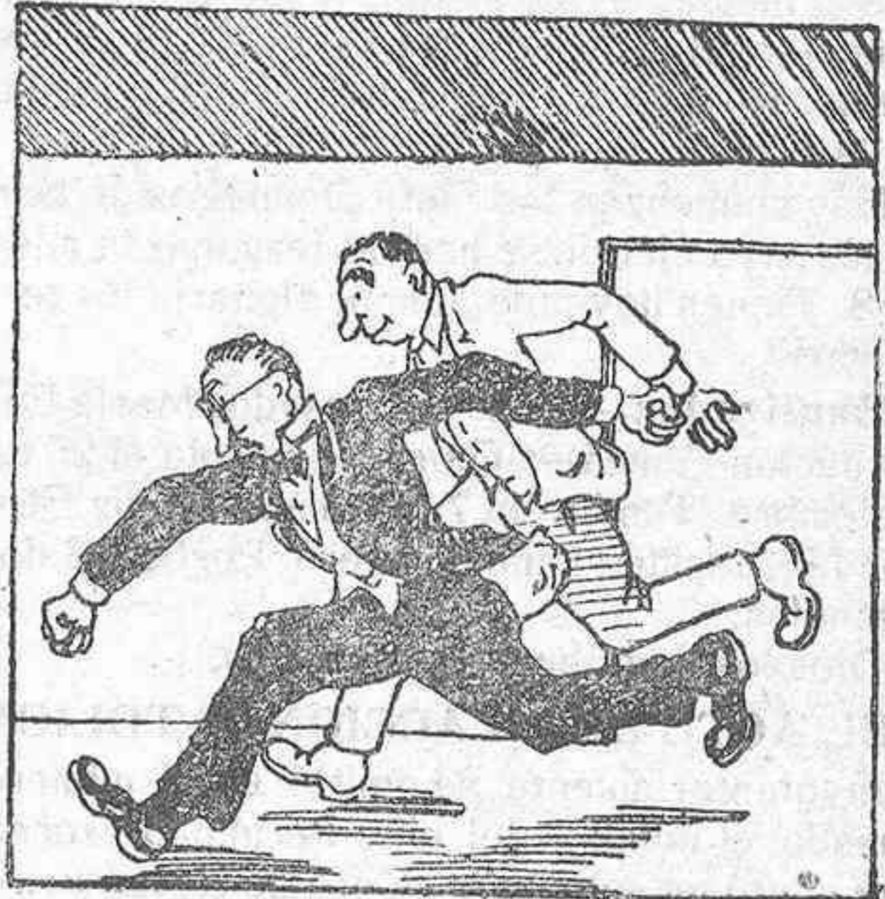
— Corramos allá ¿Quiénes son los conspiradores?