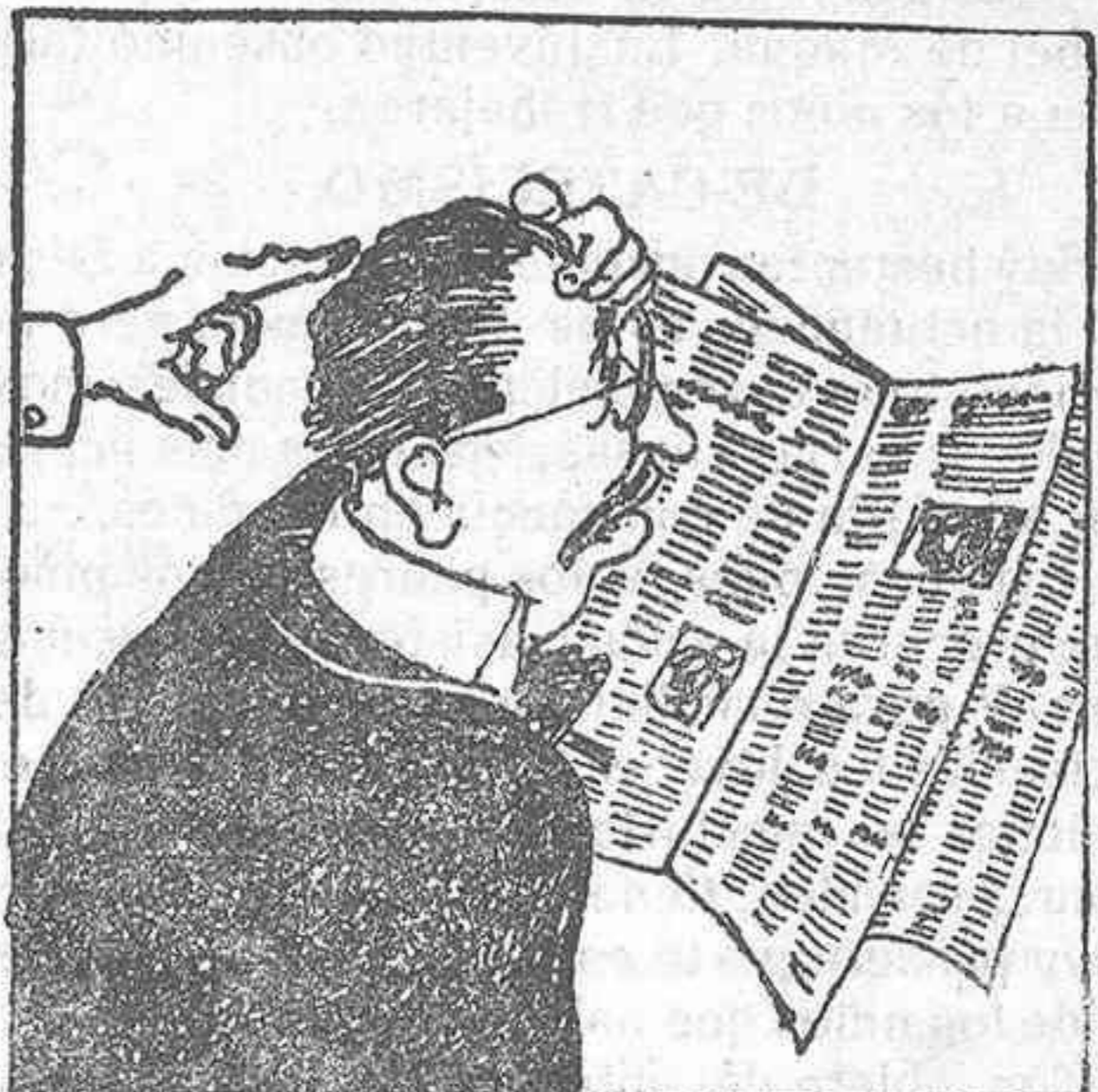
— ¡Ah!; pero son los periódicos ¿Que le vamos a hacer? Es la libertad.

Comentario: ¡Así nos luce el pelo! De estos vientos que libremente se siembran no es extraño que se recojan las tempestades que estamos recogiendo.