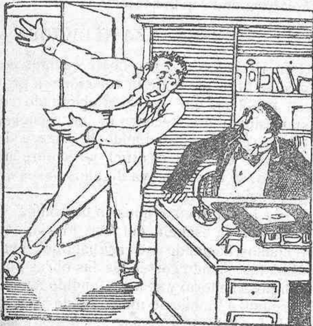
— Señor, allí se está conspirando contra sus intereses.