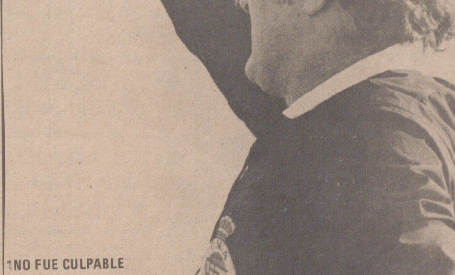
¡NO FUE CULPABLE