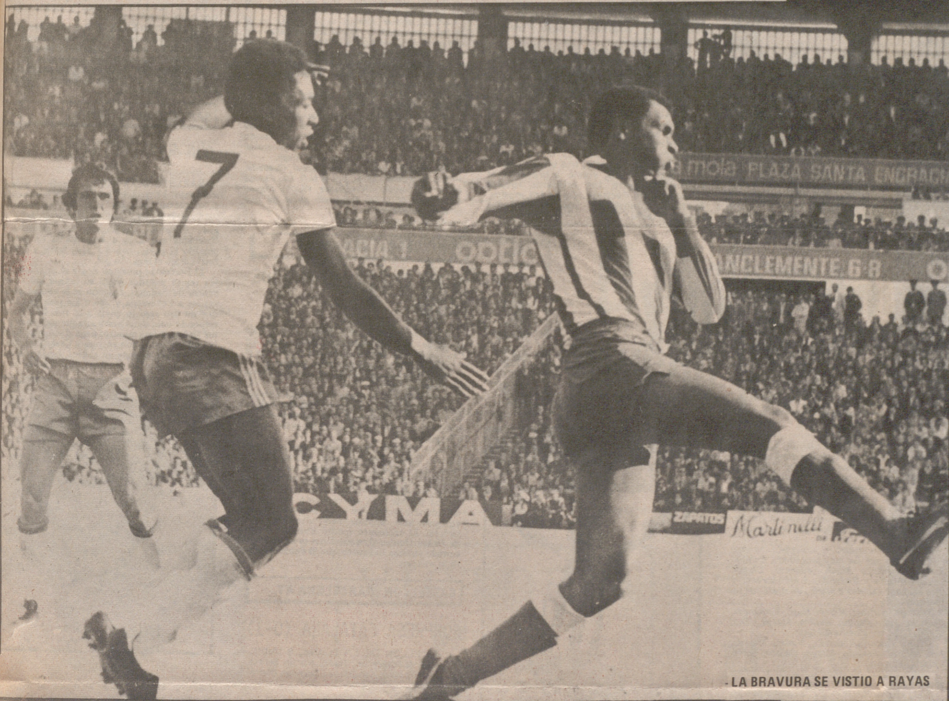
LA BRAVURA SE VISTIO A RAYAS

E STO no hay quien lo arregle, porque aunque lógicamente pasó lo que en buena lógica tenía que suceder, ya que el Atlético de Madrid teóricamente y en la práctica es muy superior al Zaragoza, salió a relucir una vez más la flojedad de nuestro equipo que se le ve desmoralizado y roto para salir a flote de lo que parece un inevitable naufragio. Ya casi nos queda la única esperanza de que otros equipos —léase Celta y Santander— nos tiendan la tabla de una salvación que dudosamente estamos mereciendo.