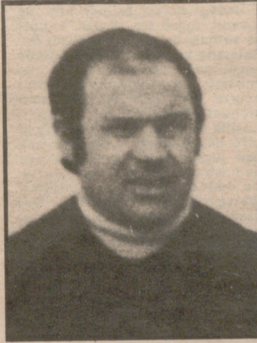
equipo y aunque de "palabra" han logrado que les dirija de nuevo para ver de lograr el anhelado ascenso.

En el Sástago recuerdan su brillante etapa anterior con el