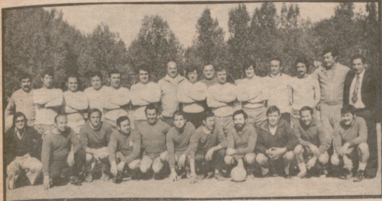
LA FIESTA DE LOS ENTRENADORES

Ya están programados los actos del "Día del Entrenador", que se celebrará D. M. el próximo 20 de Junio.