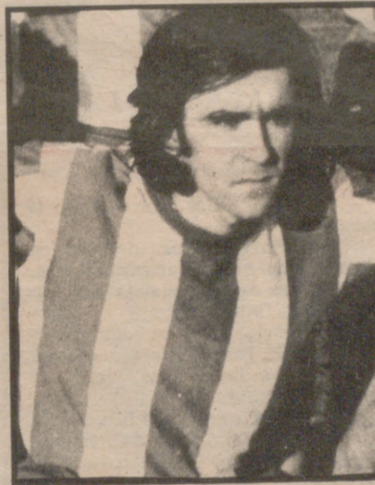
EL EXTREMO EJEANO CARNICER QUIERE ASCENDER