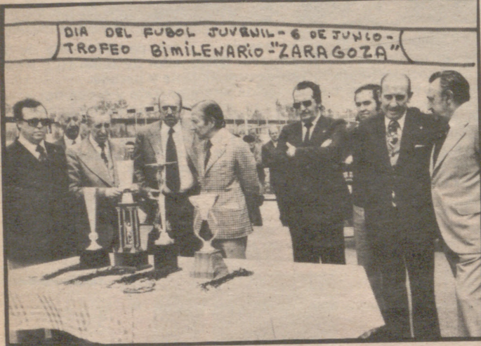
DIA DEL FÚTBOL JUVENIL - 6 DE JUNIO - TROPEO BIMILENARIO "ZARAGOZA"