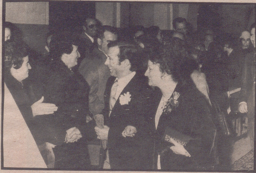
El novio del brazo de la madrina momentos antes de comenzar la ceremonia