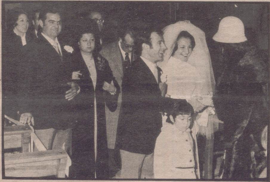
Los nuevos esposos reciben las felicitaciones de rigor