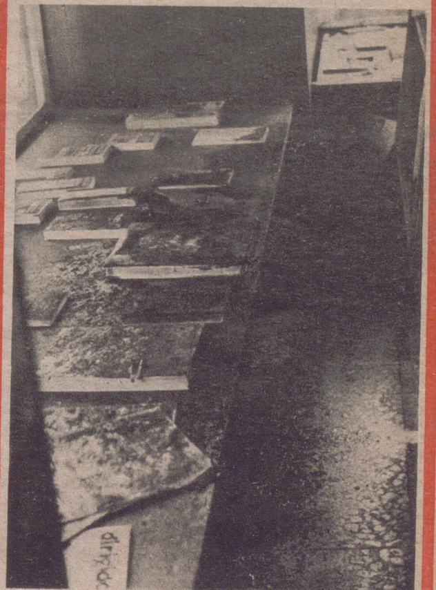
En este lugar cayó la bomba incendiaria, que penetró a través del cristal que se ve, en parte, al fondo. Por fortuna, las llamas se extinguieron con rapidez.

Los daños materiales se calculan en unas 25.000 pts.