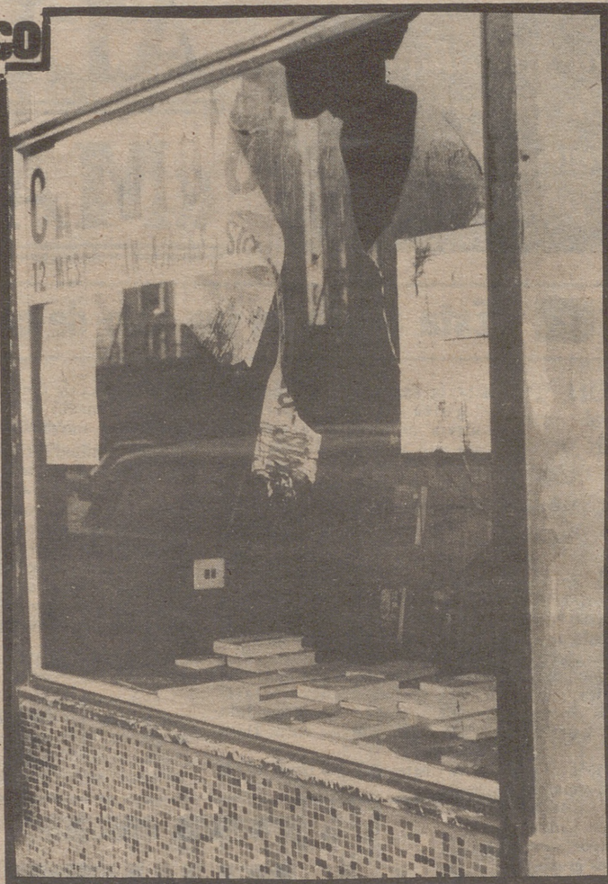
La segunda de las bombas rompió uno de los ventanales y penetró en el interior del establecimiento pero el fuego se extinguió rápidamente.

TRES meses después de haber recibido la amenaza, ésta se ha convertido en realidad anoche, a la una menos cuarto, aproximadamente, cuando una o varias personas, inidentificadas hasta el momento de redactar estas líneas, lanzaron dos bombas incendiarias —dos cócteles Molotov—, en realidad contra los ventanales que la librería "Pórtico" tiene hacia la calle Gracián, esquina a la plaza de San Francisco.