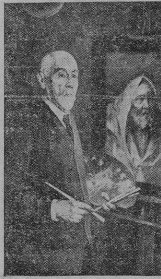
Autoretrato del ilustre pintor don Lorenzo Cerdá, a quien se rinde hoy un homenaje en Pollensa, su villa natal