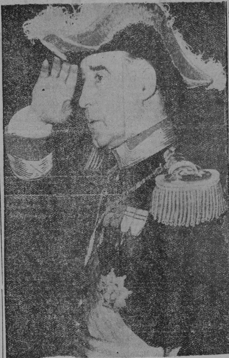
Después de cinco jornadas triunfales vividas en España, huésped de honor del Generalísimo Franco, el Jefe del Estado portugués, General Craveiro Lopes, abandonó ayer tierra española con despedida inenarrable de fervor y de hermandad hispano-lusitana